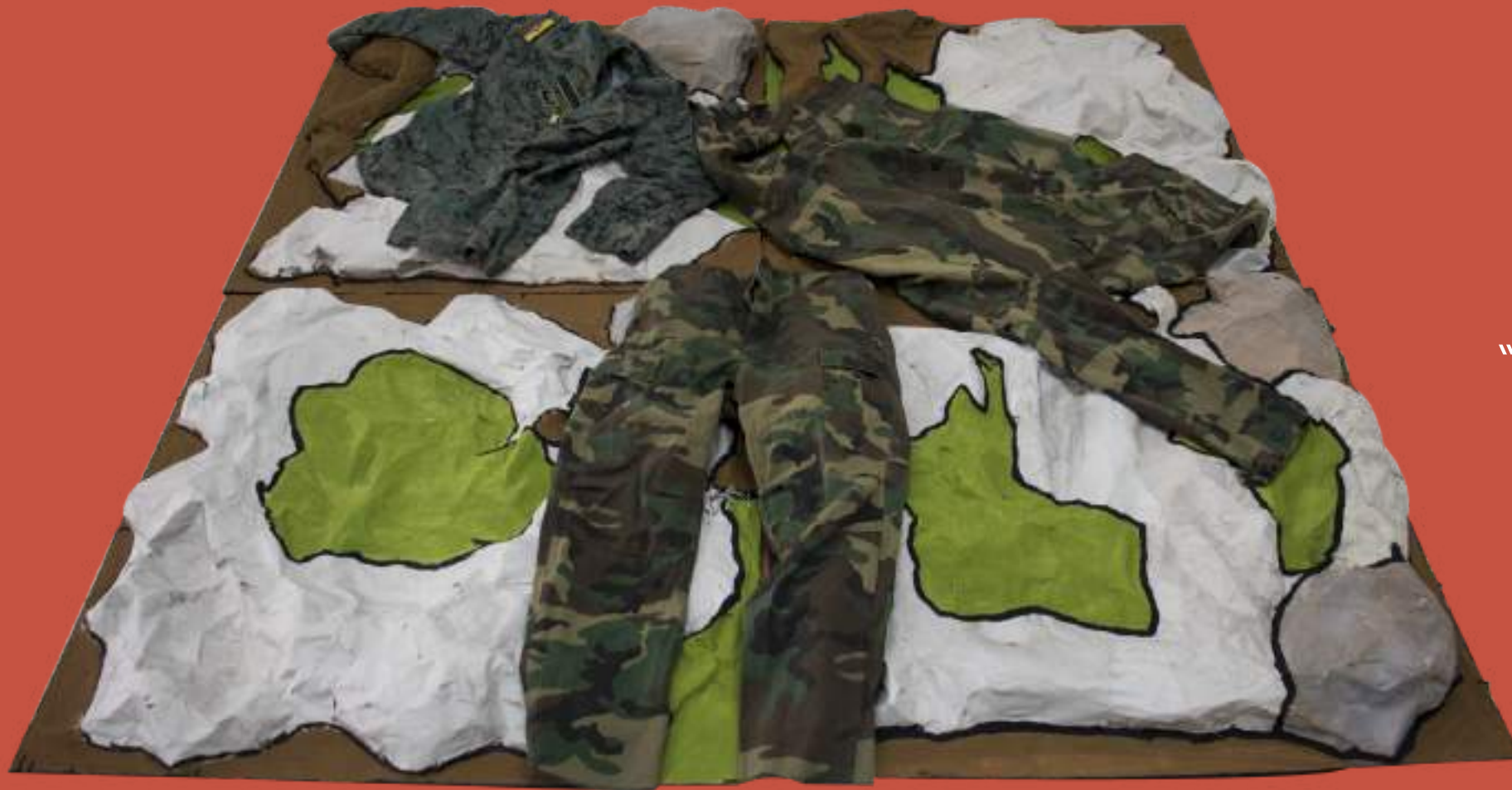
“Ni un paso atrás”, uniformes militares sobre espumaflex, 2023.

El interés por la figura de autoridad, específicamente de la figura militar como un agente caótico dentro de mi investigación y de mi interés personal para mi obra, nace con estos procesos.