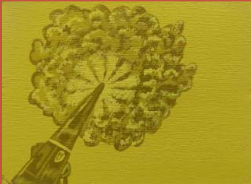
"77°38'S 166°24'E" Acrílico sobre lienzo. 2023.

En estas obras exploré aquello que mencioné anteriormente, la estética de la guerra, sus elementos, llevar a mi obra a una imagen bélica y a su vez jugar con elementos que son muy míos, como personajes que veía en series cuando era adolescente o escenarios de películas sean Sci-fi o bélicas las cuales alimentaron mi bagaje de imágenes y el interés por lo militar.