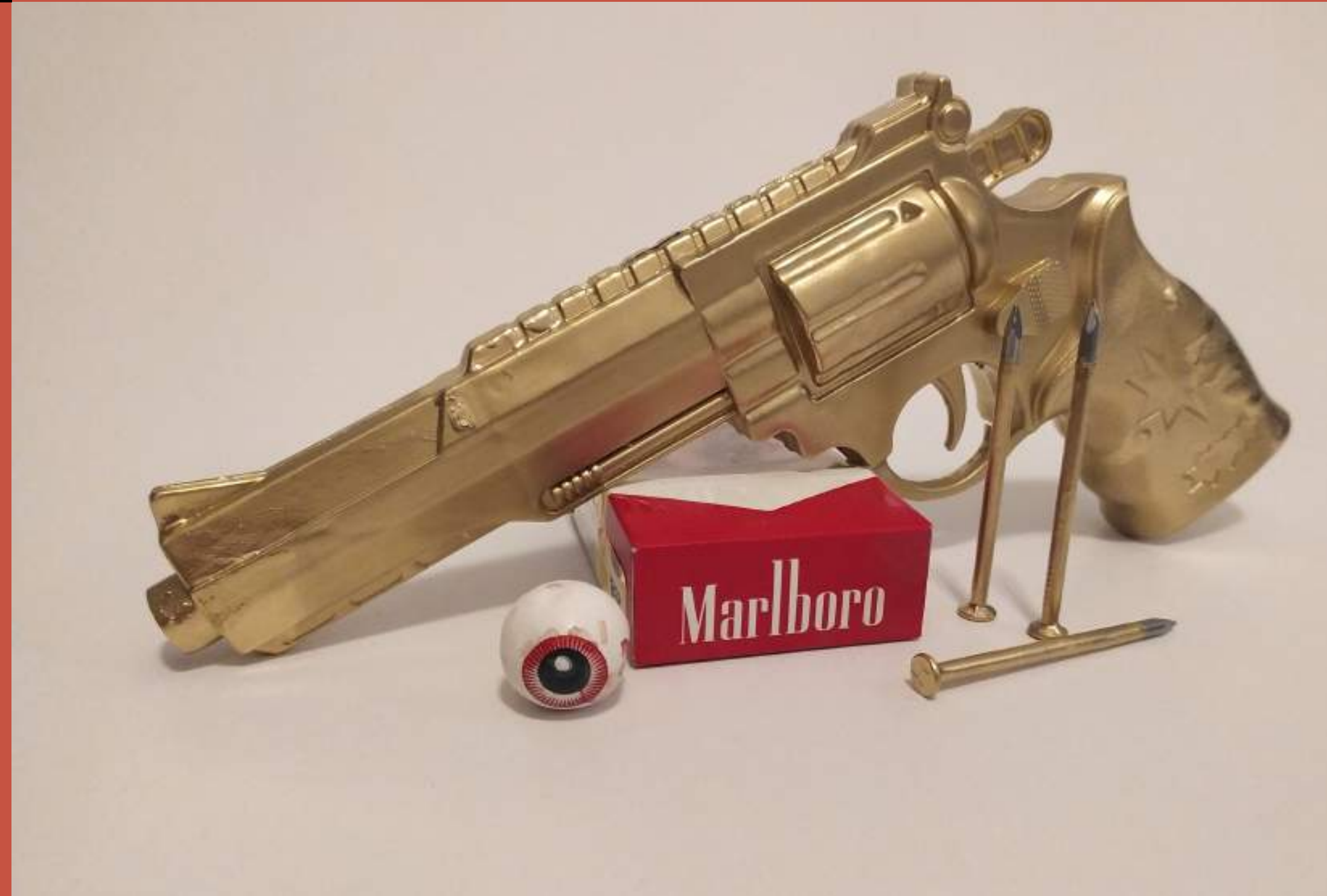
“¡Alfaro (no) vive, Carajo!”, elementos varios recubiertos en pintura de oro, 2021.

Los archivos, las imágenes de personajes populares para nuestra cosmovisión, las historias que en muchos casos suelen ser el boca a boca popular y los sucesos nacionales, han inspirado mi trabajo y me han permitido abordarlo desde diversas aristas, entre ellas el lenguaje y lo popular como una salida para generar una visión un tanto satírica de personajes y momentos muy ecuatorianos.