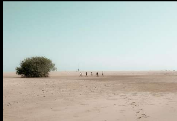
Algunas de las fotografías de Paisajes / costa y sierra de Ecuador / 2023

El interés por el paisaje se vincula estrechamente con mi trabajo actual en fotografía. Inspirado por el cine de Andréi Tarkovski, busco explorar cómo los encuadres pueden transformar el significado y la percepción de un paisaje. Tarkovski es conocido por su habilidad para capturar no solo la belleza visual, sino también la profundidad emocional y narrativa a través de sus imágenes. Esta influencia me lleva a experimentar con encuadres que inviten al espectador a reflexionar y a reinterpretar el entorno natural.