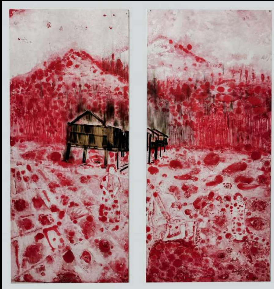
“Distopía en rojo”

“El título "Dítopía en rojo" entra en correlación con el célebre título de la obra "Armonía en Rojo" del maestro fovista Henri Matisse. Me pareció fascinante explorar cómo la intensidad del color rojo puede evocar y confrontar tanto la armonía estética en la obra de Matisse como la distopía que caracteriza la sociedad ecuatoriana contemporánea. En esta obra, el rojo no solo evoca pasión y fuerza visual, sino también simboliza los desafíos y las tensiones que enfrentamos. A través de esta elección cromática, busco confrontar y reflexionar sobre los contrastes entre la belleza idealizada y la cruda realidad, haciendo eco de la indiferencia social que define nuestra era distópica.