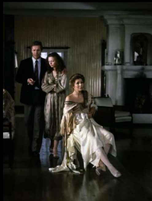
Capturas de pantalla / sacrificio / Andréi Tarkovski

Decidí inspirarme en el cine de Andréi Tarkovski, en especial en sus obras Nostalgia y sacrificio, que en general considero un referente fundamental en mi trabajo. Me atrajo especialmente la contemplativa belleza de sus imágenes y la forma en que utiliza el fuera de campo para sugerir significados más allá de lo visible. En este sentido, elegí cuidadosamente dos escenas de sus películas para integrarlas en la composición de mi obra, buscando capturar esa profundidad emocional y narrativa que caracteriza su estilo cinematográfico único. Al hacerlo, las he convertido en parte de mi propio imaginario e interpretación, tanto técnica como compositivamente.