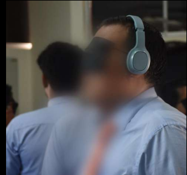
Ejercicio de paisaje sonoro con profesores

Las opiniones o impresiones obtenidas eran resultado del aislamiento o indiferencia con que reacciones algunos sectores de la ciudad. Una de esas expresiones que más resonó en mí fue: ¡los sonidos eran muy exóticos! Ese fue el punto de partida para este proyecto que aborda la idea de la indiferencia social.