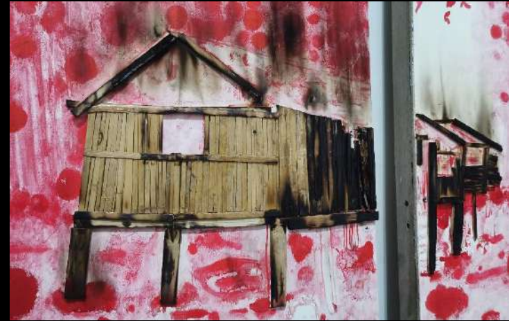
Detalles de obra "Distopía en rojo"