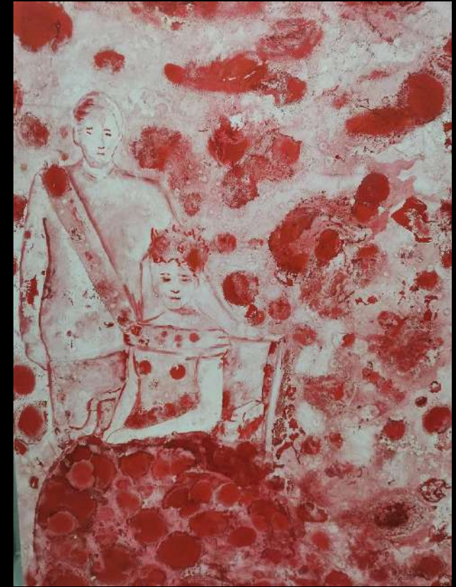
Detalles de obra "Distopía en rojo"

Es un fuera de campo porque, aunque conocemos el drama existente, lo percibimos como algo aislado, aunque vivamos en el mismo lugar. No presenciamos el problema, pero sabemos que existe.