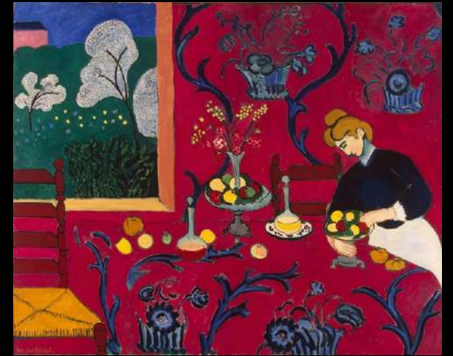
Armonía en Rojo / Henri Matisse