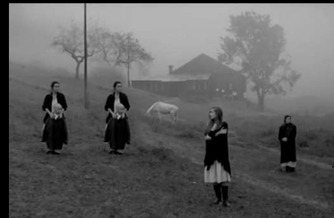
Captura de pantalla / Nostalgia / Andréi Tarkovski