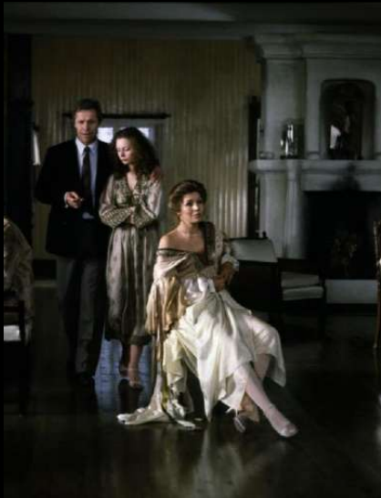
Fuera de campo