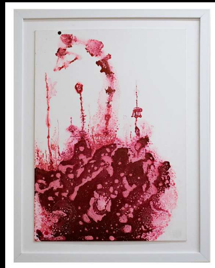
Parte de la obra "Pulsión - Eros"