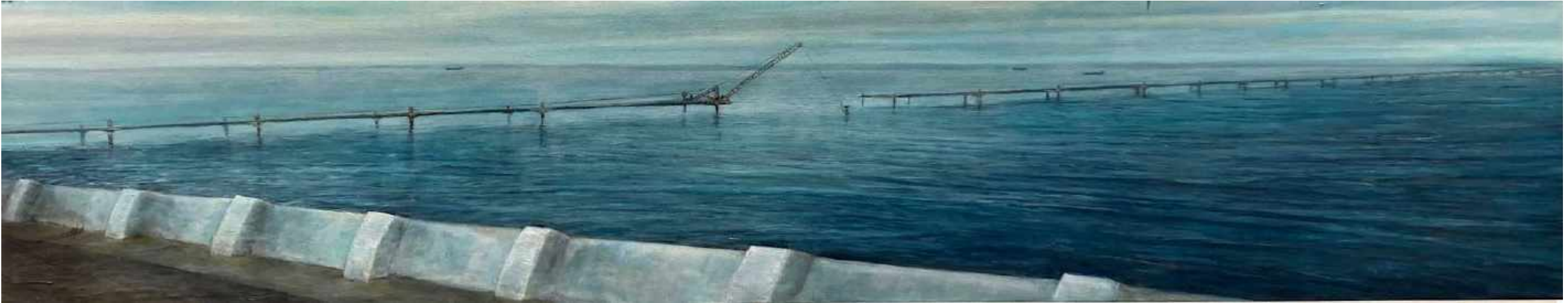
Estrecho de Magallanes Frontera Chile y Argentina. Oleo sobre lienzo 200 x 40 cm 2017