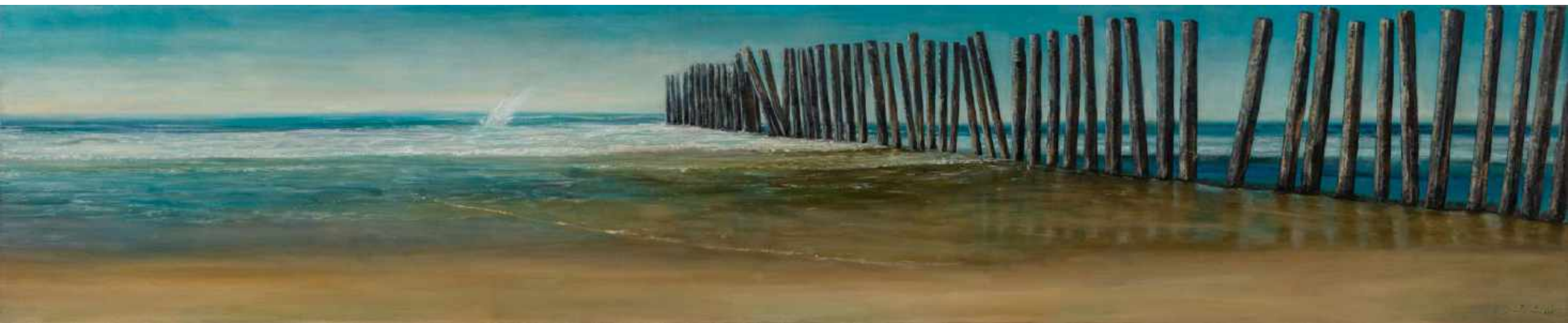
El Límite Frontera Mexico y Estados Unidos. Tijuana Oleo sobre lienzo 200 x 40 cm 2012