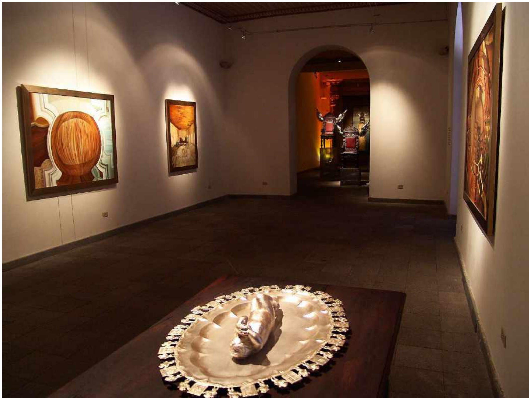
2007 Serie Axis Mundi