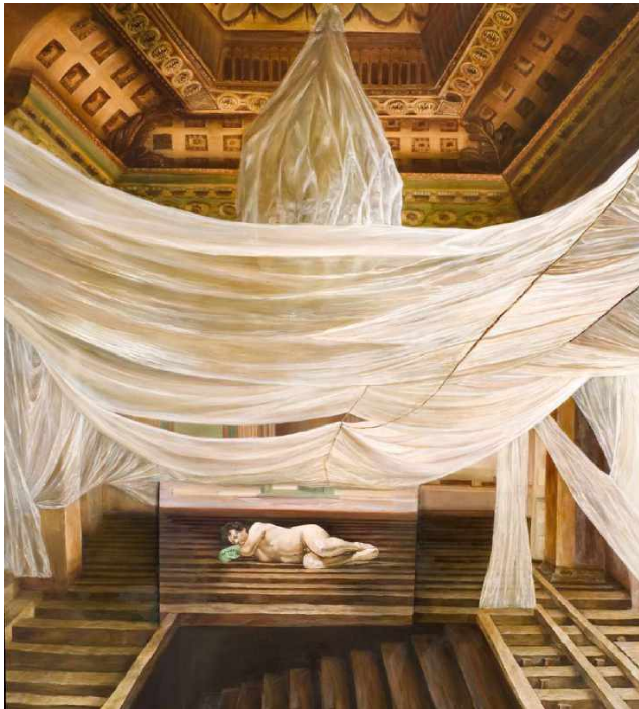
Invernadero Oleo/lienzo 190 x195 cm