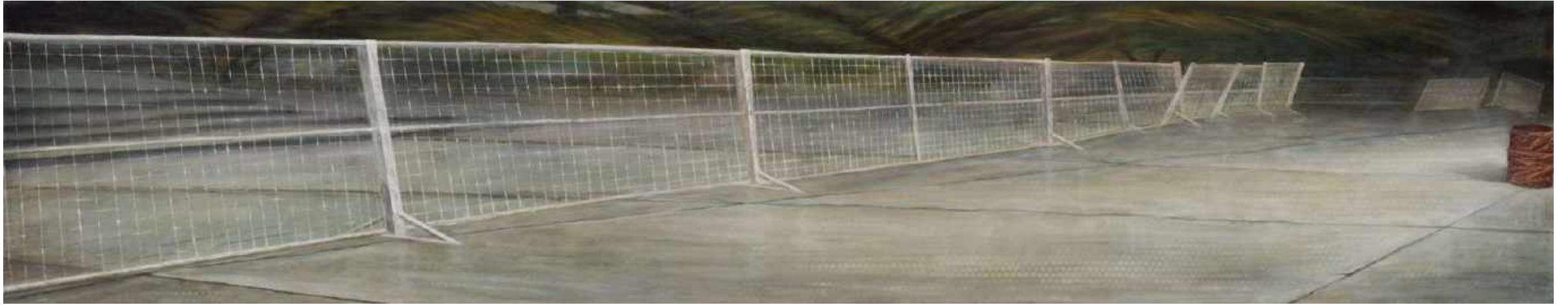
Frontera II Oleo/lienzo 200 x 40 cm 2008