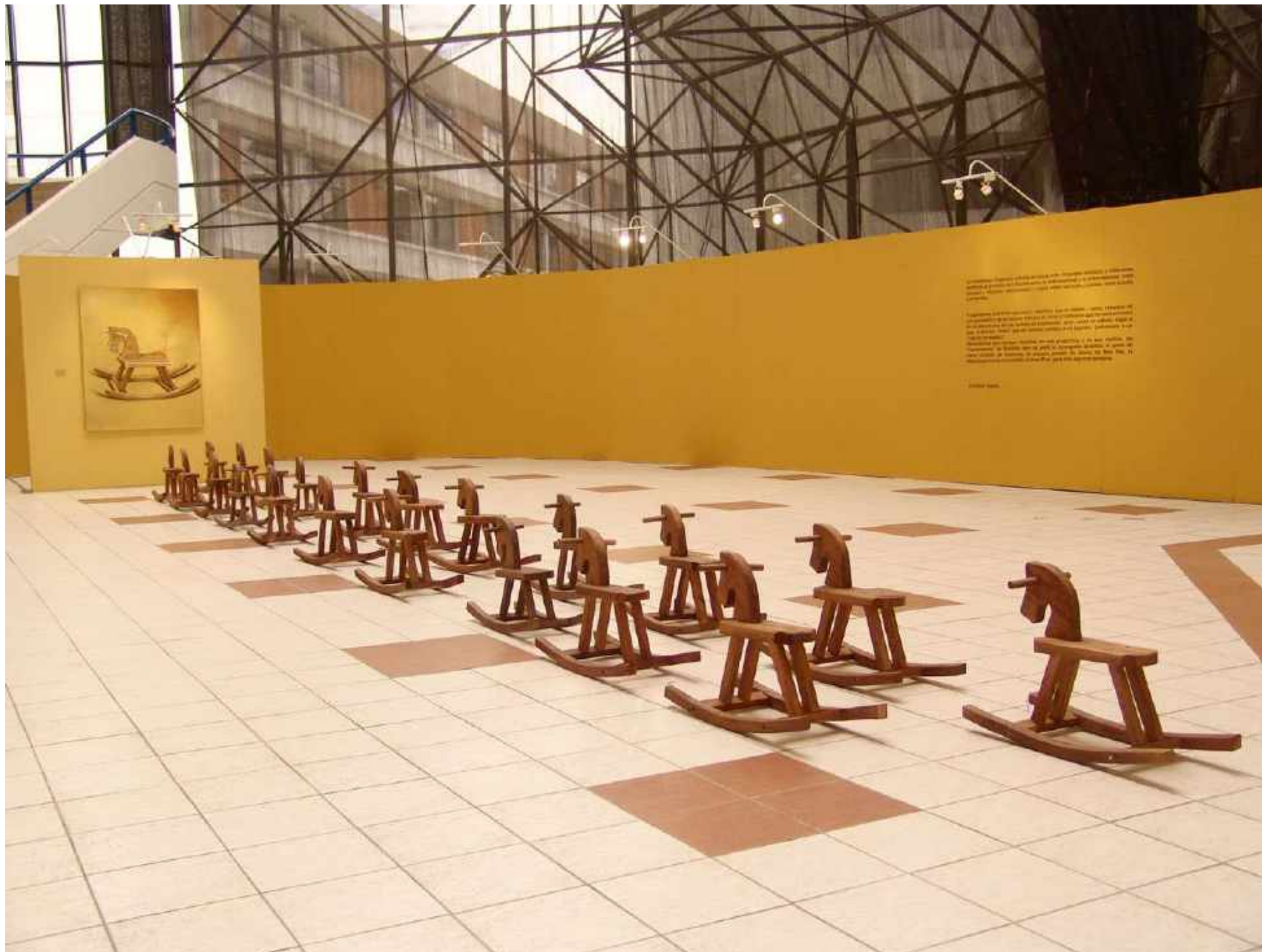
Instalación: Pederasta, caballitos de madera de roble, óleo /lienzo 150 x 120 cm