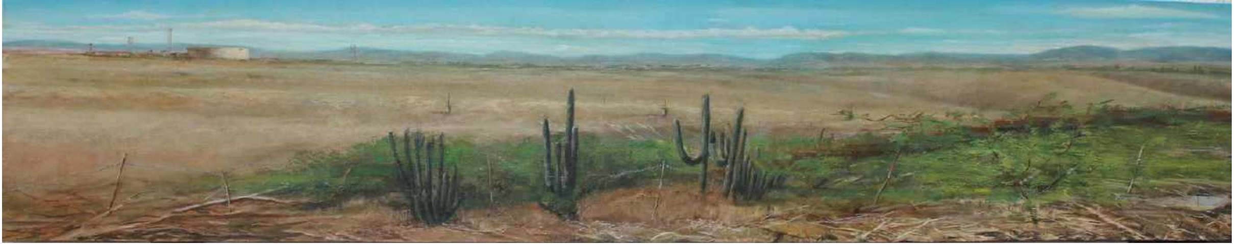
Los Tanques Frontera Mexico y Estados Unidos. Nogales Oleo sobre lienzo 200 x 40 cm 2017