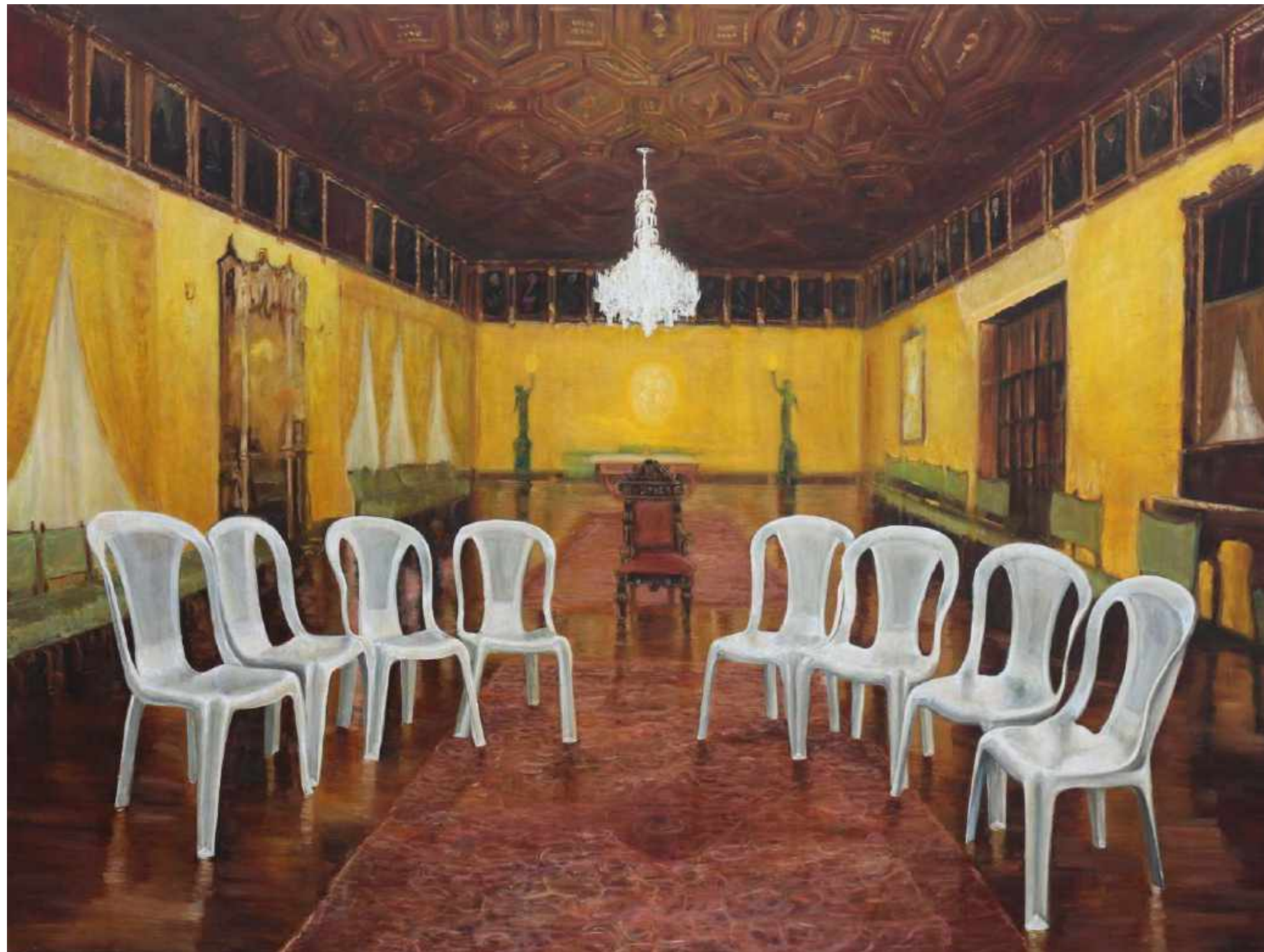
Soledad del Poder Oleo/lienzo 1.50x 1.20 cm