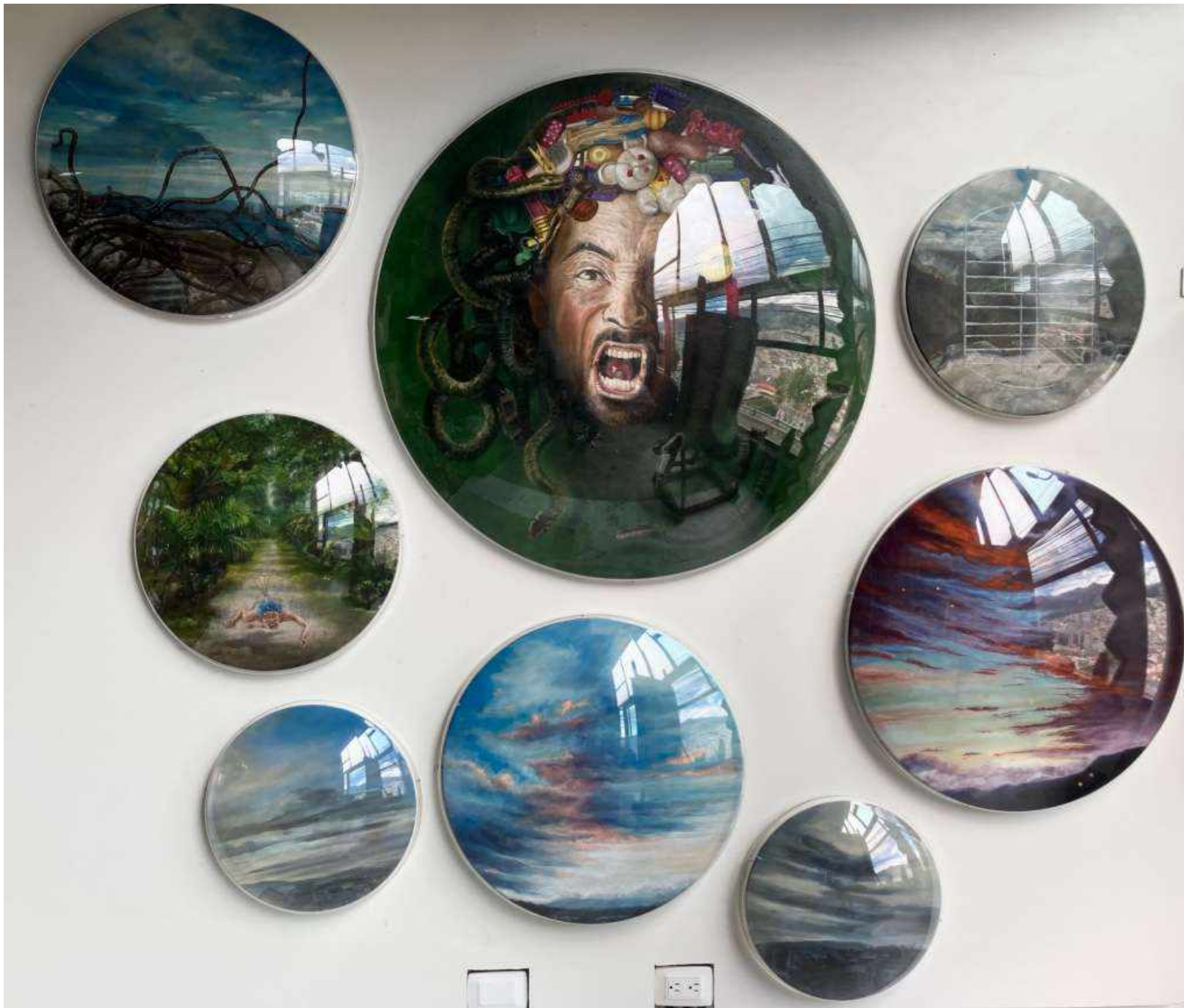
Oleo/lienzo con burbuja de acrílico. Diámetros variables