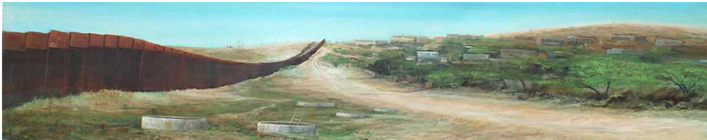
Los Tuneles Frontera EEUU y Mexico. Nogales Oleo sobre lienzo 200 x 40 cm 2017