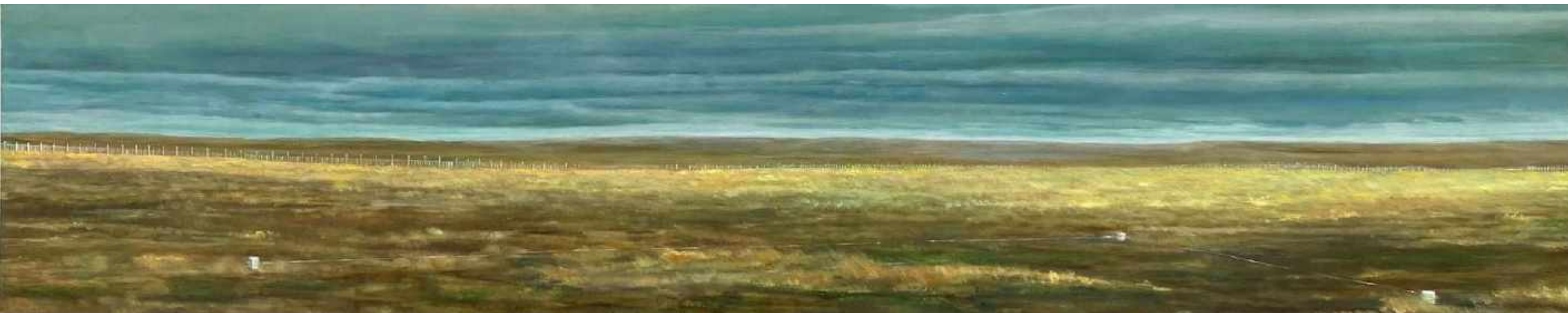
Espera Frontera Chile y Argentina. Tierra de fuego Oleo sobre lienzo 200 x 40 cm 2017