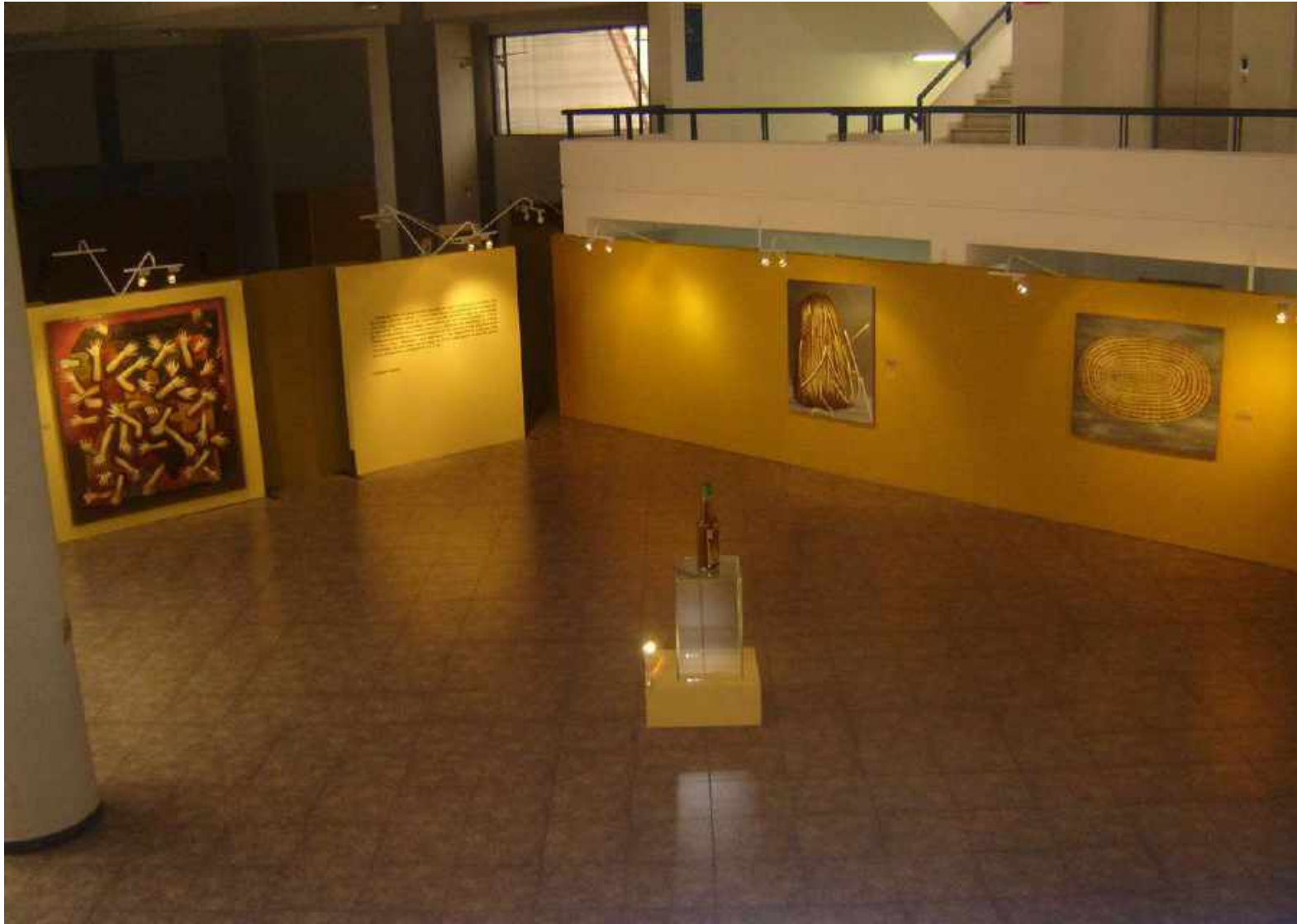
2006 Serie Memoria de las Cosas