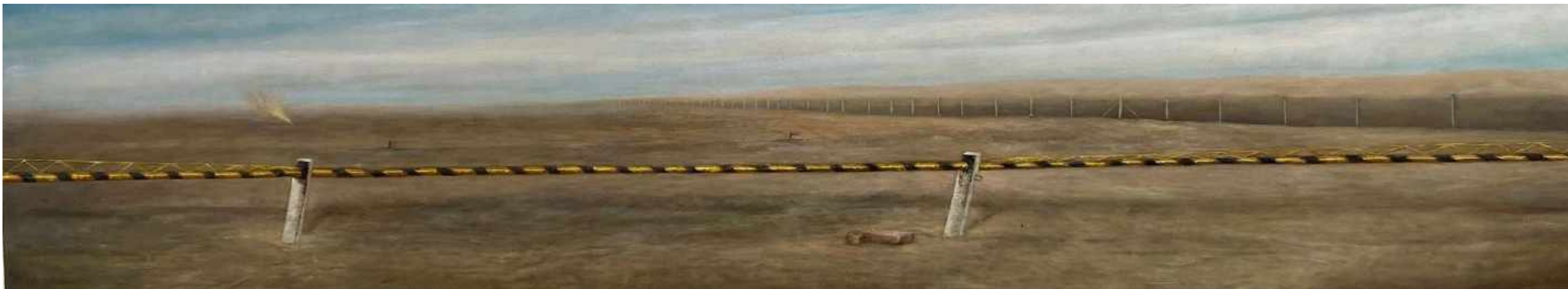
Arica II Frontera Chile y Perú. Arica Oleo sobre lienzo 200 x 40 cm 2013