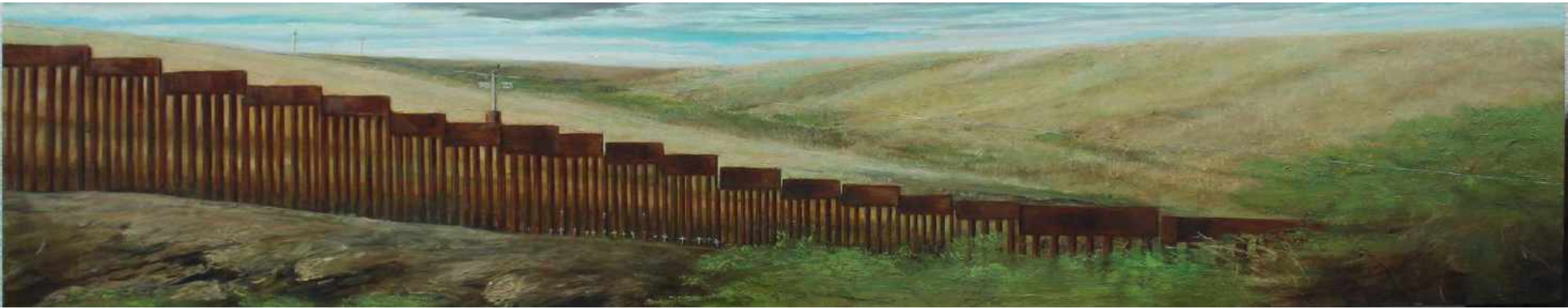
Nogales Frontera Mexico y Estados Unidos. Oleo sobre lienzo 200 x 40 cm 2017