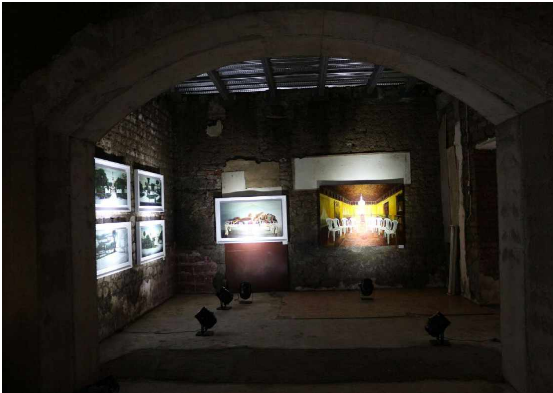
2013 Instalación pictórica "Gris" en antiguo hotel quemado