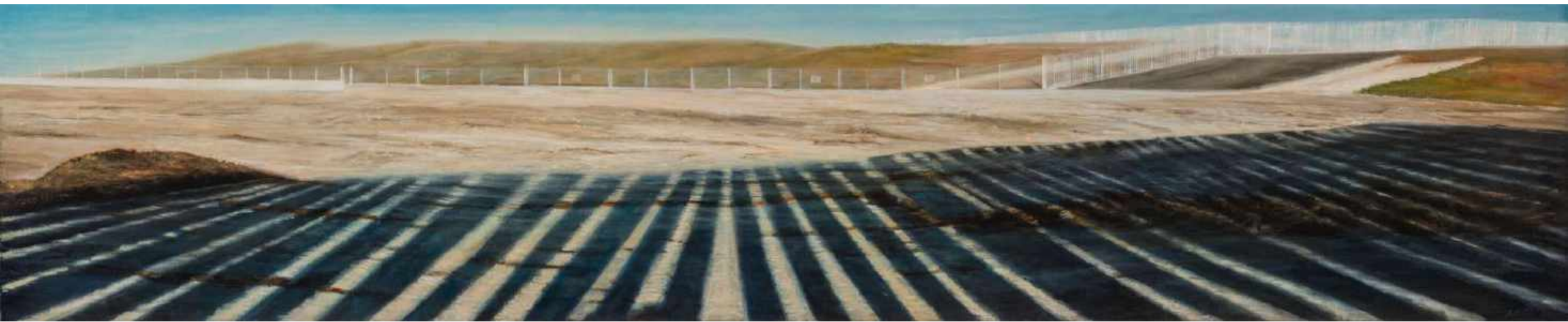
Hostil Frontera Mexico y Estados Unidos. Tijuana Oleo sobre lienzo 200 x 40 cm 2012