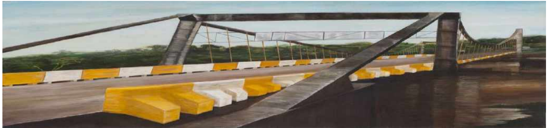
Putumayo Frontera Ecuador y Colombia Oleo sobre lienzo 170 x 40 cm c/u 2010