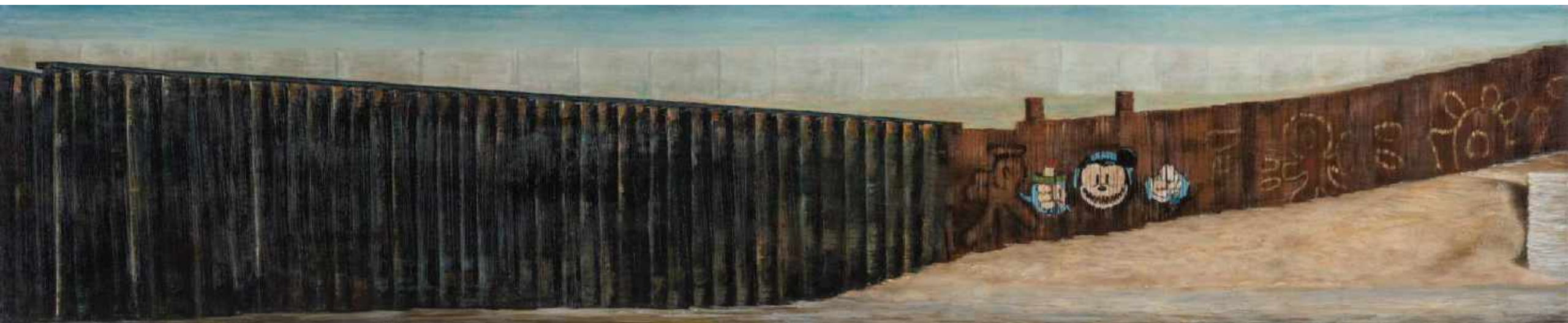
Bienvenidos.. Frontera Mexico y Estados Unidos. Tijuana Oleo sobre lienzo 200 x 40 cm 2013