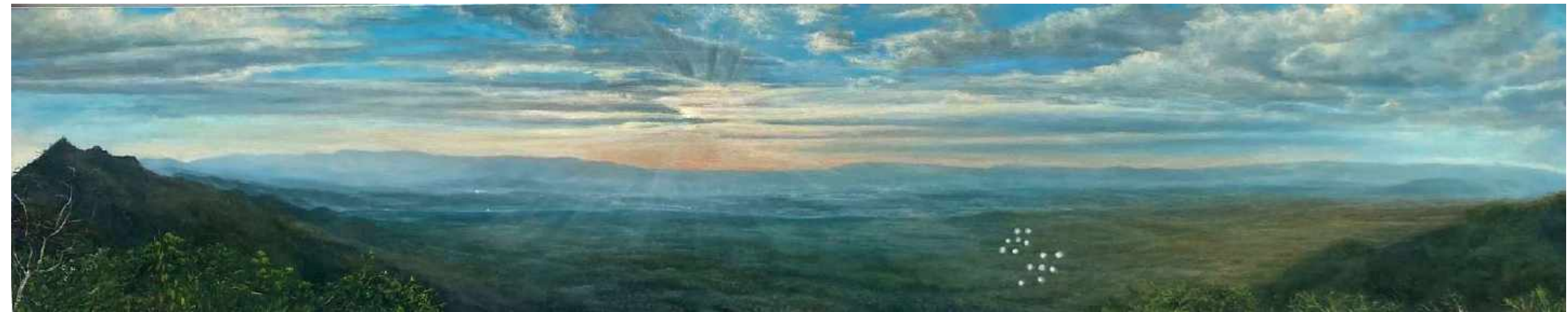
Valle Cazaderos Frontera Ecuador y Perú. Cazaderos Oleo sobre lienzo 200 x 40 cm 2021