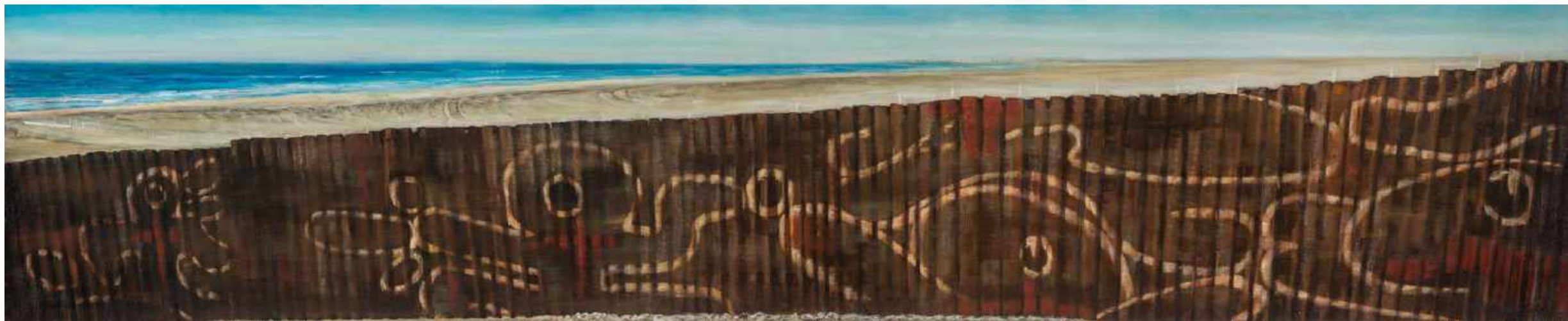
Angustia Frontera EEUU y Mexico. Tijuana Oleo sobre lienzo 200 x 40 cm 2012