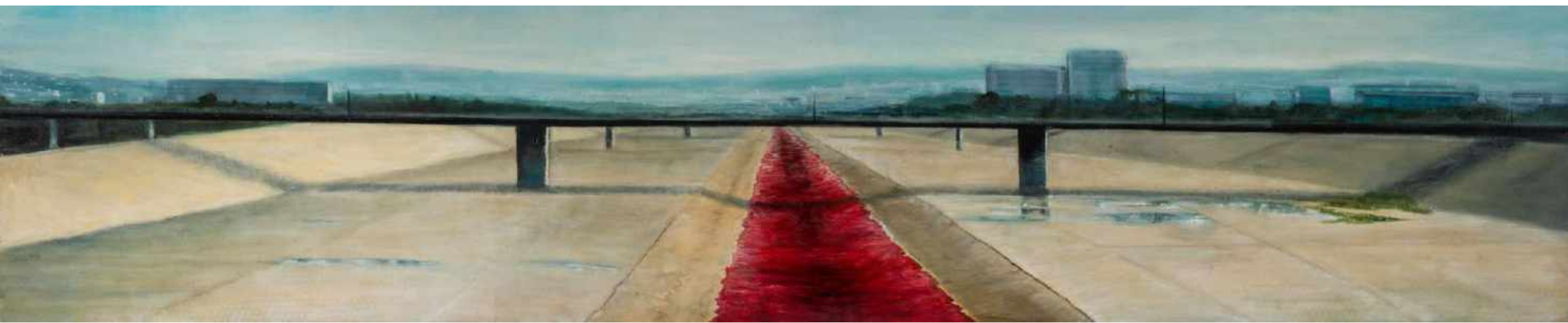
Tijuana Frontera Mexico y Estados Unidos. Tijuana Oleo sobre lienzo 200 x 40 cm 2012