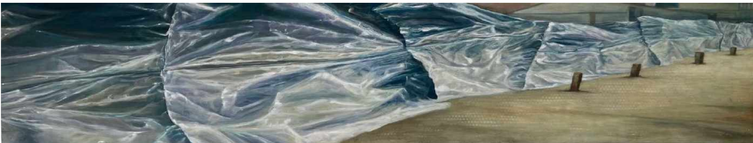
Frontera III Oleo/lienzo 200 x 40 cm 2008