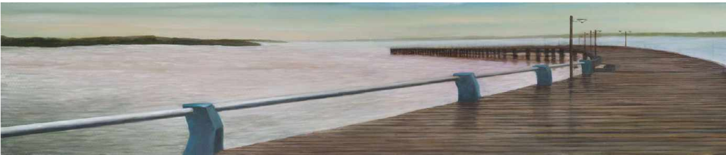
San Lorenzo Frontera Ecuador y Colombia. Esmeraldas Oleo sobre lienzo 200 x 40 cm 2009