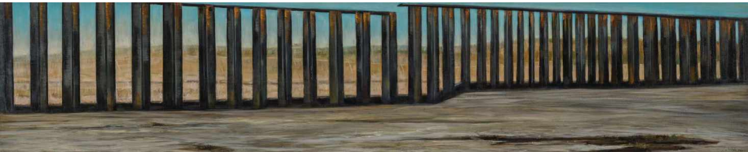
Estado de excepción Frontera Mexico y Estados Unidos. Tijuana Oleo sobre lienzo 200 x 40 cm 2012