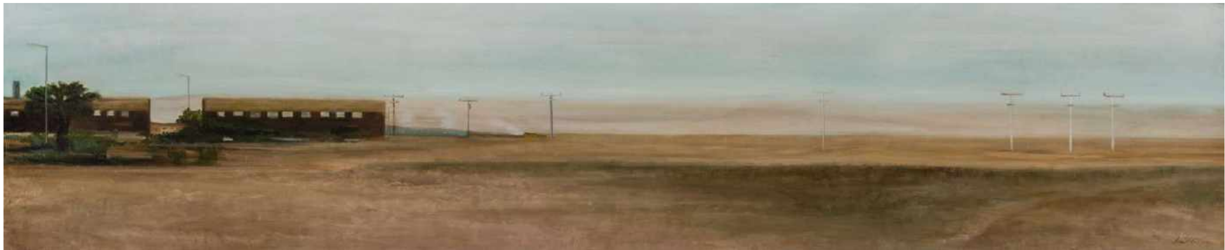
Estrecho de Magallanes Frontera Chile y Argentina. Oleo sobre lienzo 200 x 40 cm 2017