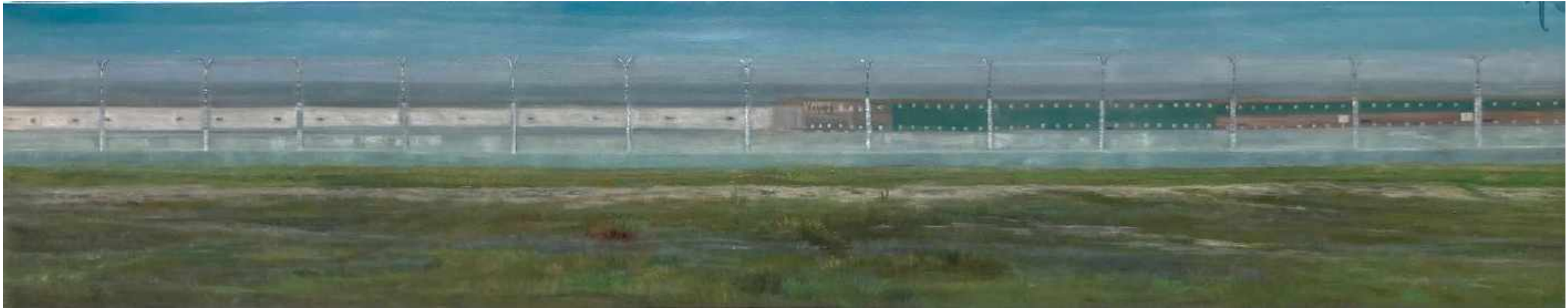
La Bestia Frontera EEUU y Guatemala. Chiapas Oleo sobre lienzo 200 x 40 cm 2013