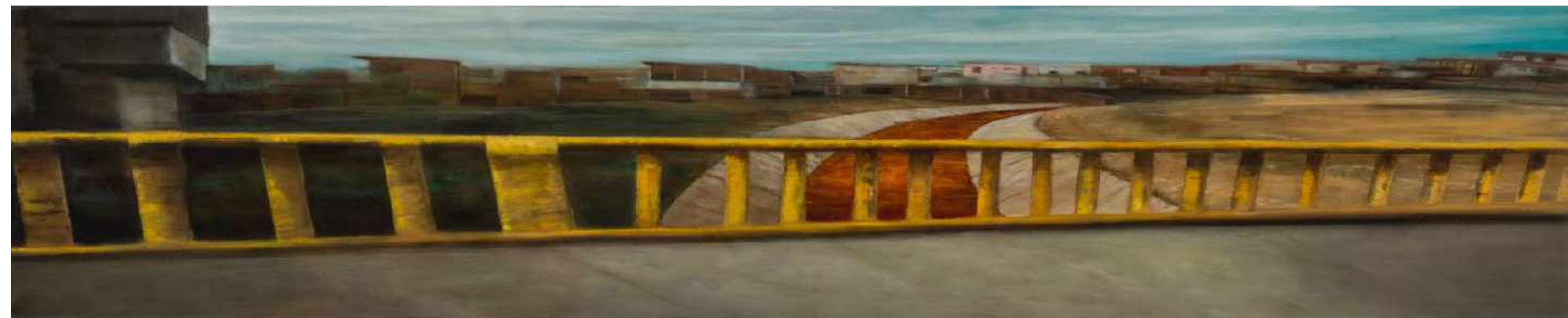
Estrecho de Magallanes Frontera Chile y Argentina. Oleo sobre lienzo 200 x 40 cm 2017