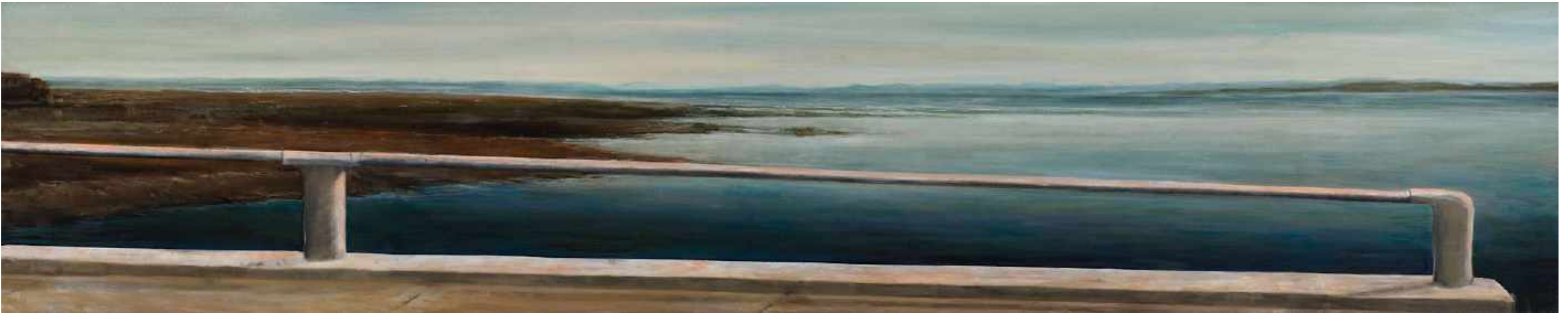
Desaguadero Frontera Perú y Bolivia. Lago Titicaca Oleo sobre lienzo 200 x 40 cm 2010