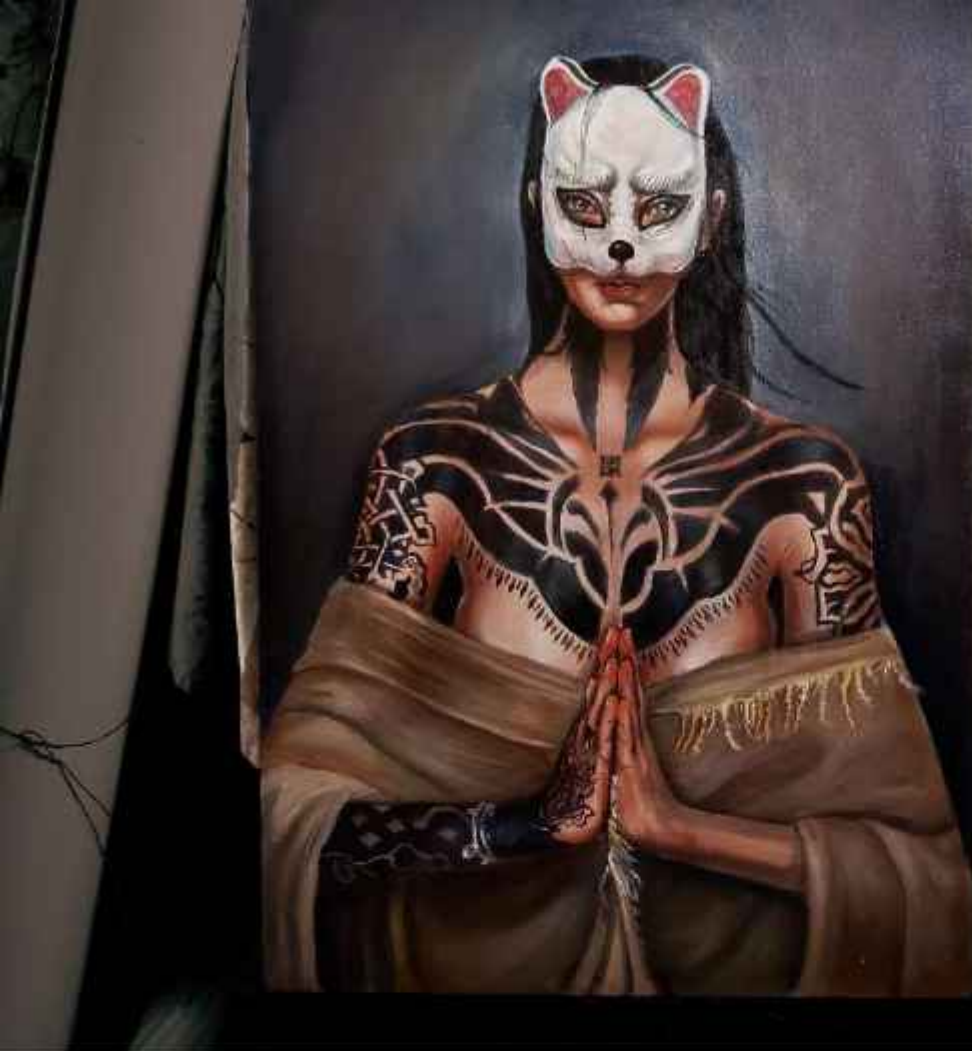
Territorios Corporales. Óleo Sobre Lienzo. Medidas: 90 cm x 60 cm. Autor: Emmanuel