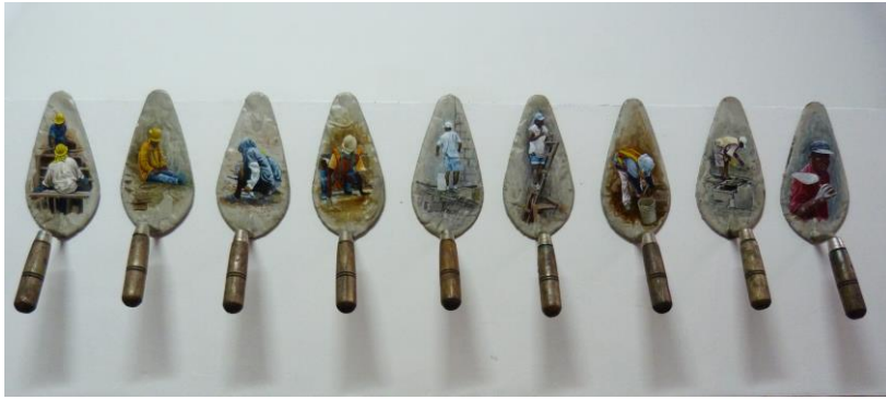
Agachaditos Acrílico / bailejos