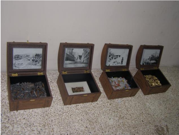
Arte objeto Memorias guayacas