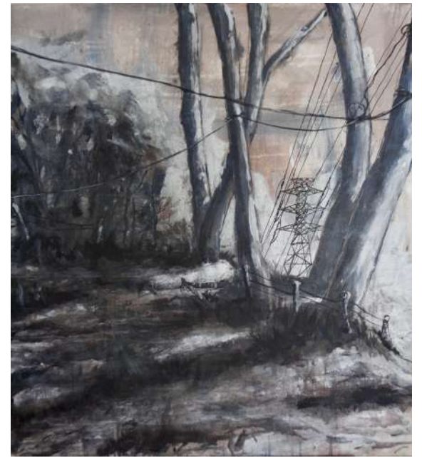
EL CHAQUIÑAN PINTURA ACRILICA SOBRE LIENZO 80 x 70 cm. 2023

“RAPSODIA URBANA” SERIE DE PINTURAS ACRILICAS SOBRE LIENZO 80 x 280 cm. 2023 DIMENSIONES DEL MOTAJE