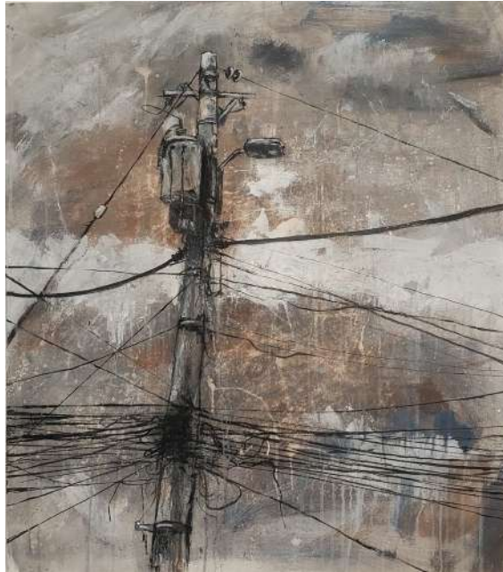
ACOMETIDAS PINTURA ACRILICA SOBRE LIENZO 80 x 70 cm. 2023