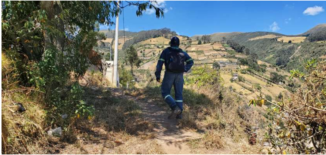
ILUSTRACIÓN 1. REGISTRO FOTOGRAFICO