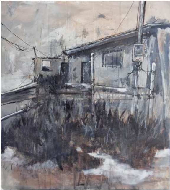
LINDERO PINTURA ACRILICA SOBRE LIENZO 80 x 70 cm. 2023