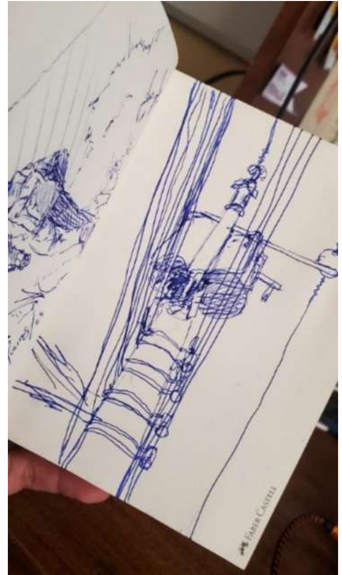
ILUSTRACIÓN 2. APUNTES DE POSTES