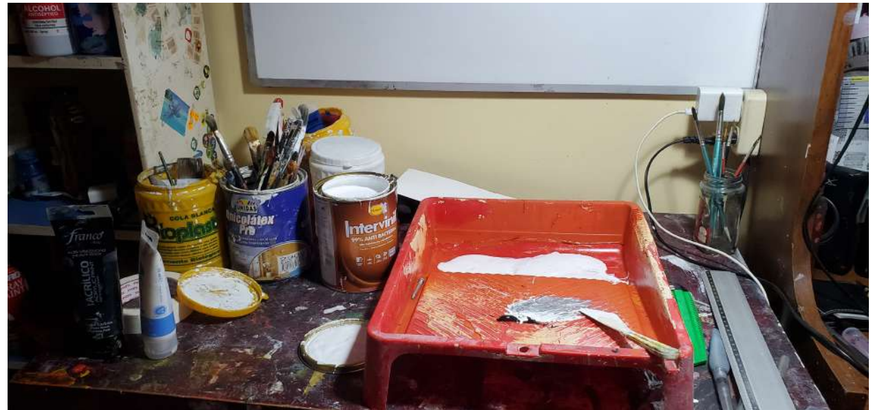
ILUSTRACIÓN 4. MATERIALES UTILIZADOS