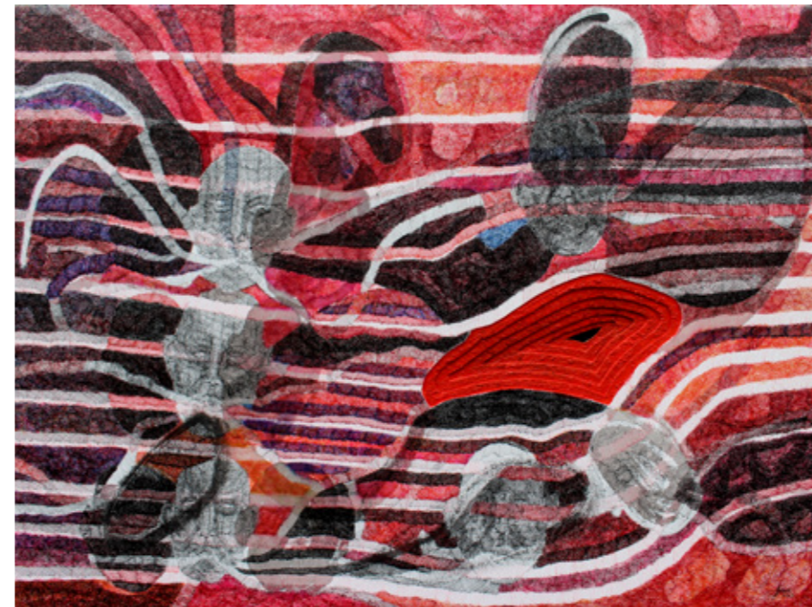
"Verbos rojos y horizontales"

Residencia Espacio Onder. Guayaquil, 2021