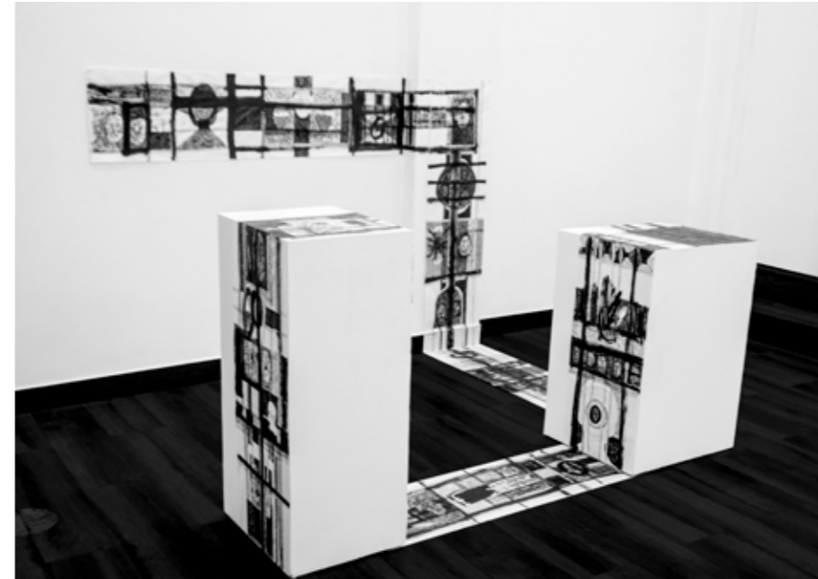
"Violencia plástica de orden obsesivo"

Toda obra tiene una suerte acumulativa, y esta no es la excepción; con mi necesidad de recorrer ciudades, hasta el momento he realizado una serie de residencias que han desencadenado a "Entrecruzamientos" ; Quito, Guayaquil, Punta del Este y Buenos Aires, han sido de mucha importancia para el aporte conceptual de esta obra. El recorrer por distintas configuraciones urbanas, culturales y sociales han sido el germen para interesarme en la máscara, el lenguaje, el espacio y su juego de escalas, que de alguna manera trato de encontrar de manera arquetípica.