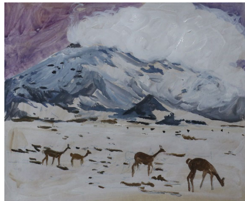
Reserva de Producción de Fauna – Chimborazo