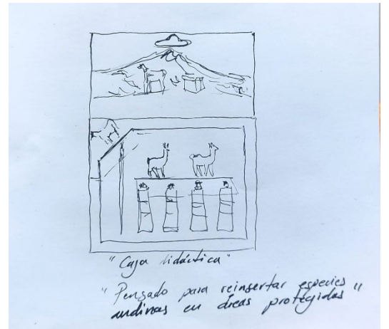
Boceto final – Pintura en lienzo y objeto intervenido