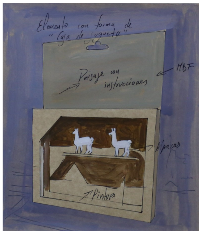
Boceto – Modelo de caja de juguete

La Reserva de Producción de Fauna Chimborazo presenta conflictos socio-ambientales entre los comuneros y el Estado, debido a que las comunidades han subsistido y desean seguir subsistiendo con actividades de agricultura y ganadería, a su vez, el Estado desea lograr los objetivos de conservación con la incorporación de los camélidos andinos en la zona.