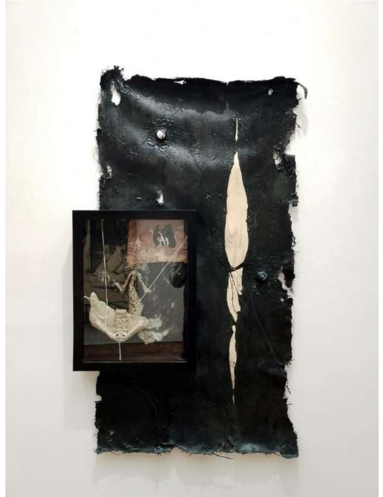
...A part of our blasphemy resides en our head.. Acrílico y lápiz/ lona, 230x170 cm, 2023.

Mientras que en el aspecto conceptual, el dualismo de las cosas al igual que la evolución humana, su comportamiento y el misticismo de nuestra existencia son los tópicos protagonistas.