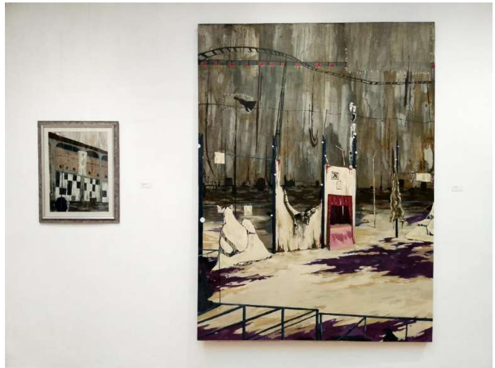
De animales a ??? Acrílico y lápiz/ lona, 230x170 cm, 2023.