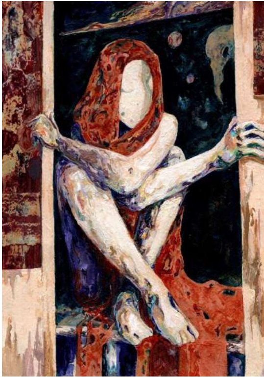
The Elder egegor.