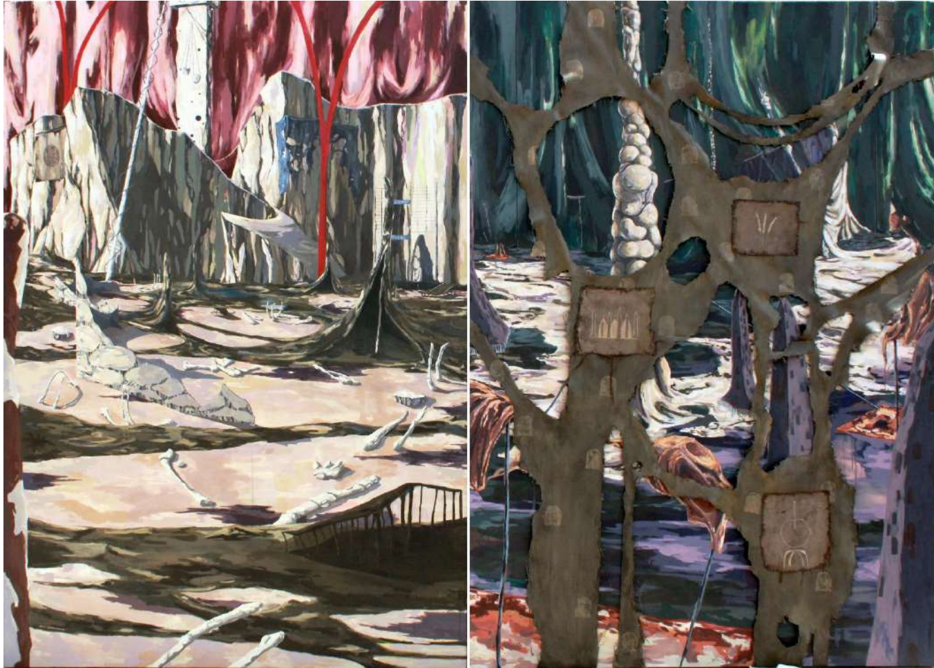
El libreto que un día disfrazó al animal integral. Acrílico, lápiz y tela cosida/ lona, 220x300 cm, 2023.