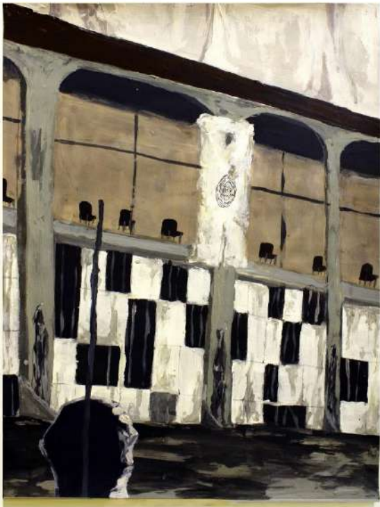
Estudio "De animales a ???" Acrílico y lápiz/ cartulina, 61x45 cm, 2023.

En mi producción utilizo constantemente imágenes que refieren a escenarios de teatro inhóspitos pero cuya utilería da una idea de presencia. En estos ambientes trabajo el concepto "Post Animal" el cual desarrolle bajo la premisa de que el hombre es una animal que habita en una realidad en la que el género homo atraviesa cambios específicos para convertirse en el hombre actual.