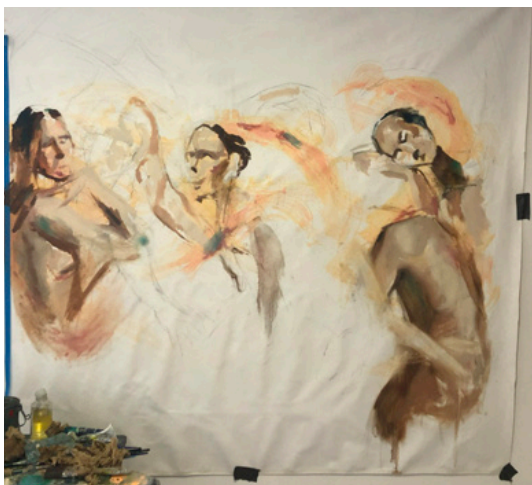
Fragmentum Vis Viva, fotos de proceso, 2024

Por otro lado, la cronología del proceso es testigo a su vez de lo fragmentado. Las capas de pintura son visibles en la obra como ideas sin terminar que crean un conjunto, desde el lienzo blanco que es potencial de todo, seguido de la primera mancha de pintura acrílica espontánea gestual, hasta el juego del realismo interrumpido, el ir y venir de la mancha y el equilibrio compositivo.