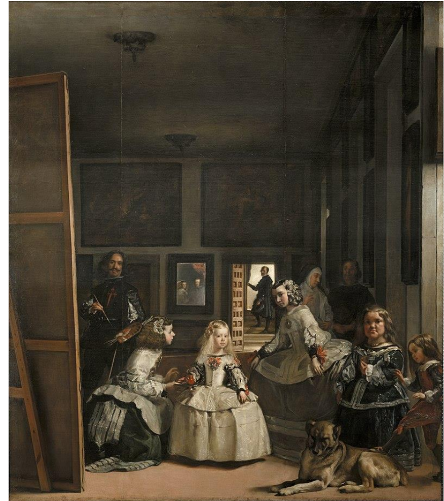
Las meninas, Diego Velázquez 1656