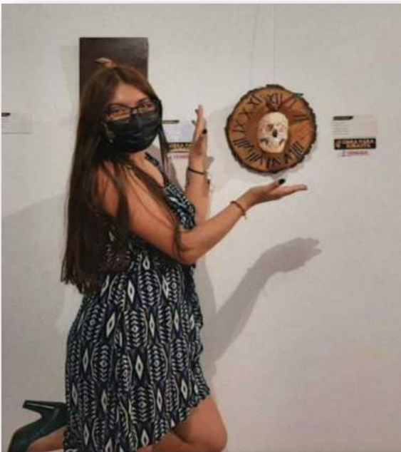
EXHIBITION AND AUCTION OF WORKS IN THE MUSEUM AND CULTURAL CENTRE MANTA-2021