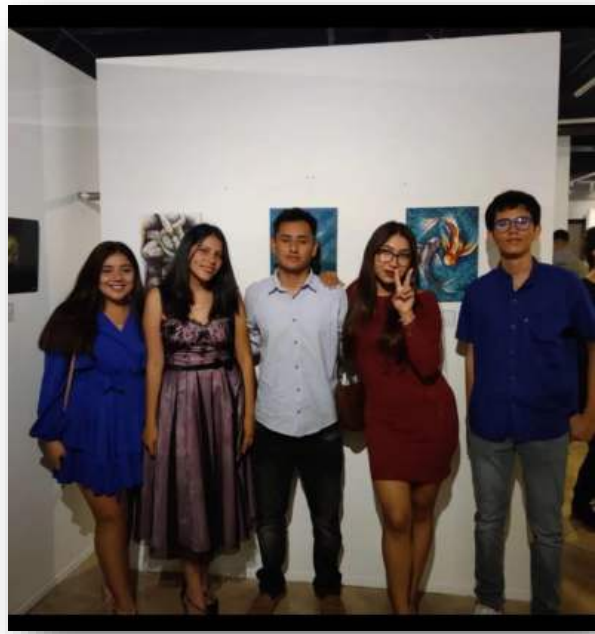
EXHIBITION AND AUCTION OF WORKS IN THE MUSEUM AND CULTURAL CENTRE MANTA-2021