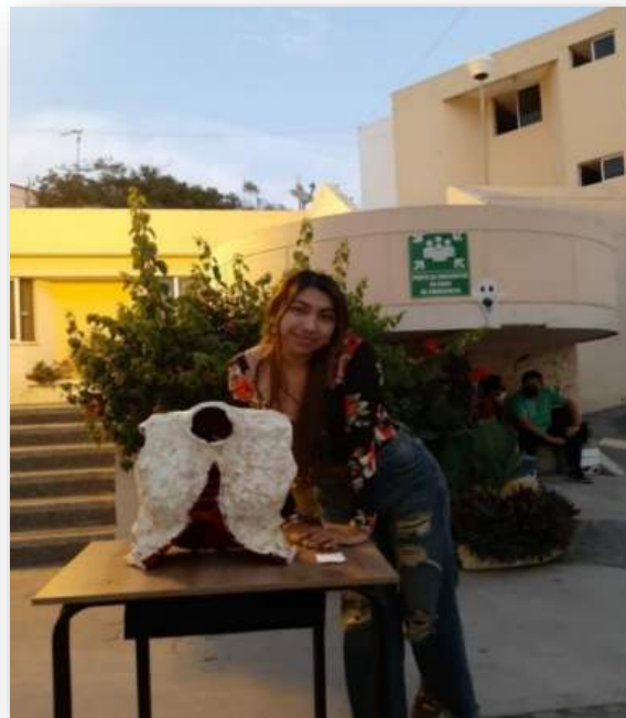
EXHIBITION OF MY WORK TEAR OF PAIN-2022