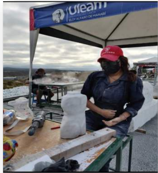
PRACTICE AT THE FIRST SCULPTURE SYMPOSIUM MAKING MY WORK VENUS-2022