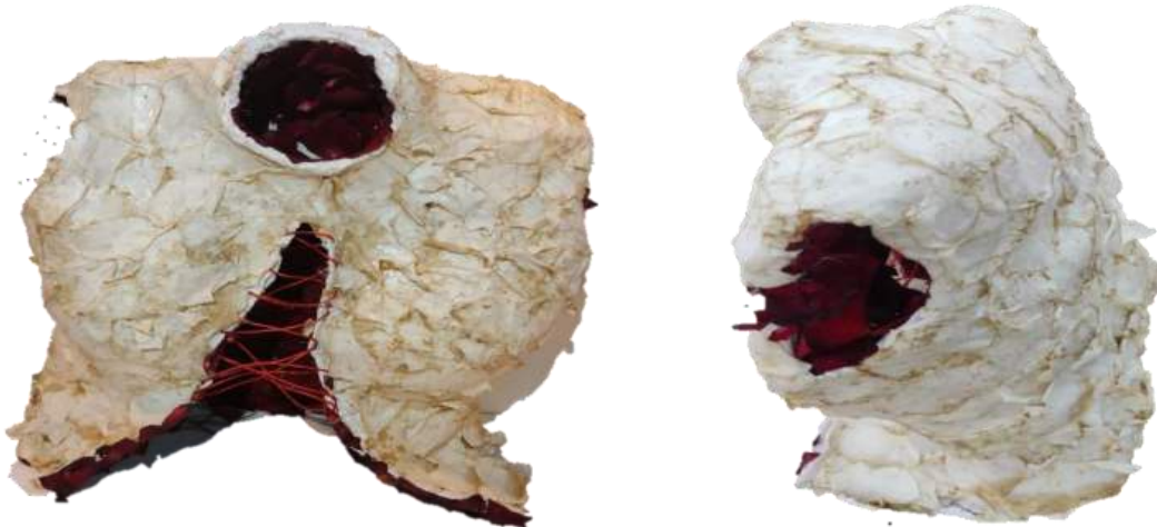
Tear of pain - Ariana Delgado 2023

Exploro la dolorosa realidad del feminicidio y la violencia hacia el cuerpo femenino a través de una representación simbólica. El torso superior de la mujer está realizado en yeso, encapsulando la fragilidad y la fuerza inherentes a la experiencia femenina. Las flores, delicadamente entrelazadas con la estructura, simbolizan la esperanza y la resiliencia, contrastando con la brutalidad representada en la forma. Esta pieza invita a reflexionar sobre la dualidad de la feminidad, desafiando al espectador a confrontar la urgencia de poner fin a la violencia que amenaza la integridad de las mujeres en nuestra sociedad.