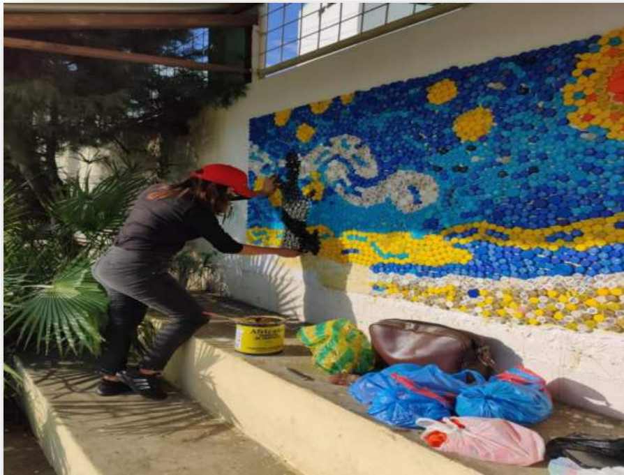
CREATION OF THE RELIEF MURAL WITH RECYCLED MATERIAL-MANTA 2023