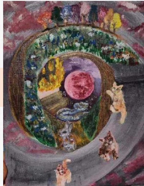
Atrapada en mis sueños Material: acrílico