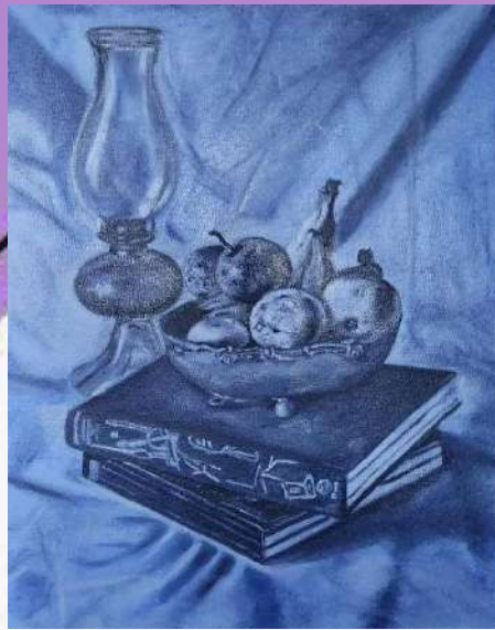
Bodegón acromático Material: óleo