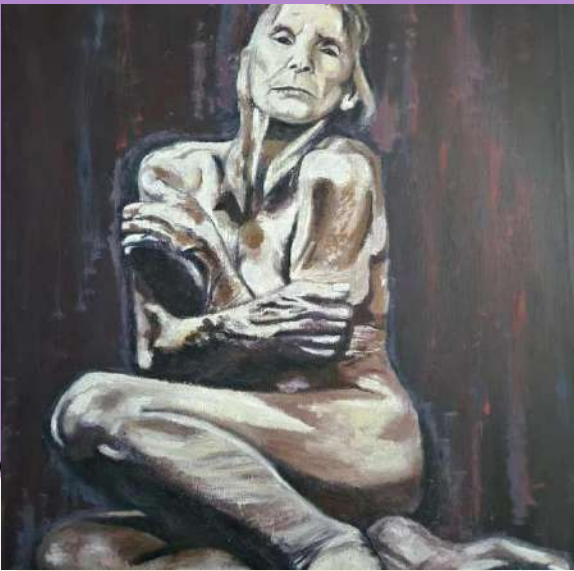
S.t Material: óleo