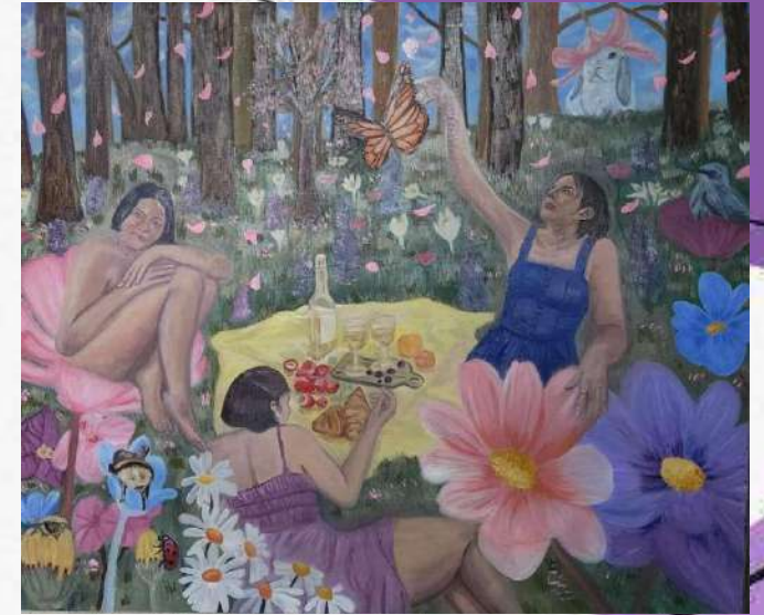
Picnic en el bosque de las maravillas Material: óleo