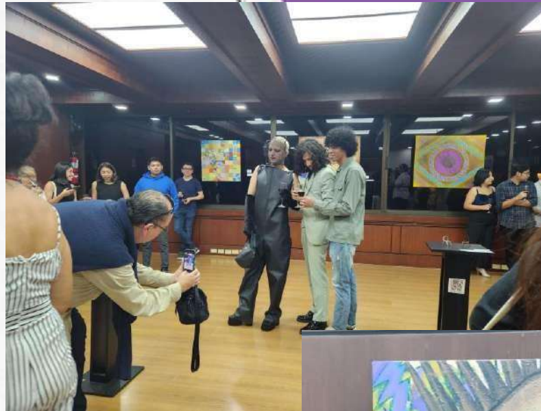
Exposición "Detonantes" en el Museo Luis Noboa Naranjo