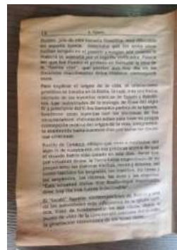
Fotografía del libro personal sobreviviente

Los planteamientos de Oparin no constituyen “verdades” o marcos metodológicos reduccionistas, sino, pautas de reflexión y discusión pluriparadigmáticas. Reescribo algunos textos claves en el proceso creativo que actúan en forma de enunciados, palabra viva o revivida.