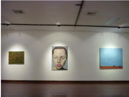
* Al centro una obra del artista en el Museo Municipal de Guayaquil.

-2013 octubre, seleccionado en el 14FAAL , exposición en el Museo Municipal de Guayaquil . Al centro una d elas obras del artista en el Museo Municipal de Guayaquil.