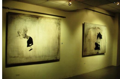
* Obras del artista en el MAAC, Guayaquil, actualmente Centro Cultural Libertador Simón Bolívar.

2014, Exposición colectiva "La puerta enrollable" , en la Galería Dpm ; Guayaquil.