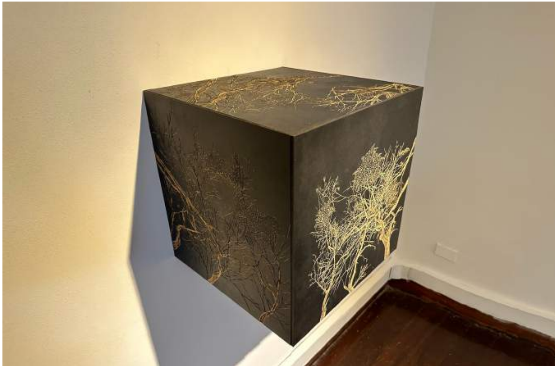
BLACK BOX Grabado sobre mdf 40cm x 40cm x 40cm 2023