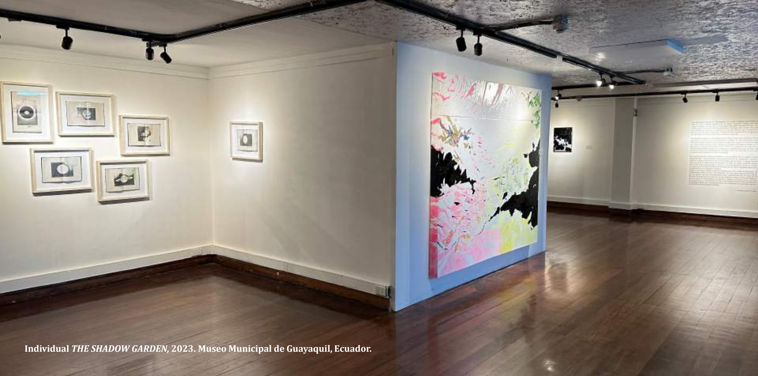
Individual THE SHADOW GARDEN , 2023. Museo Municipal de Guayaquil, Ecuador.