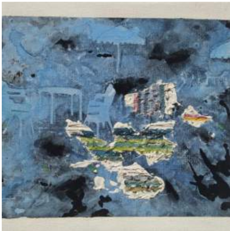
DE DÍA, SIN SOL Acrílico y esmalte sobre lienzo Medidas variables 2020