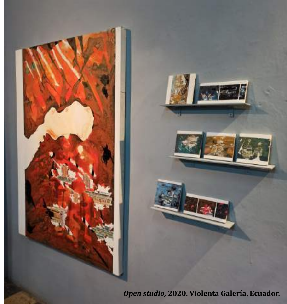
Open studio, 2020. Violenta Galería, Ecuador.