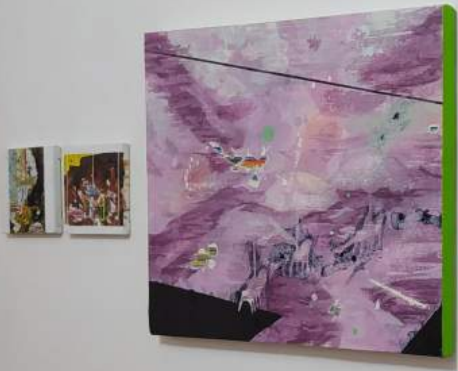
LA ESTACIÓN Acrílico y esmalte sobre lienzo Medidas variables 2020