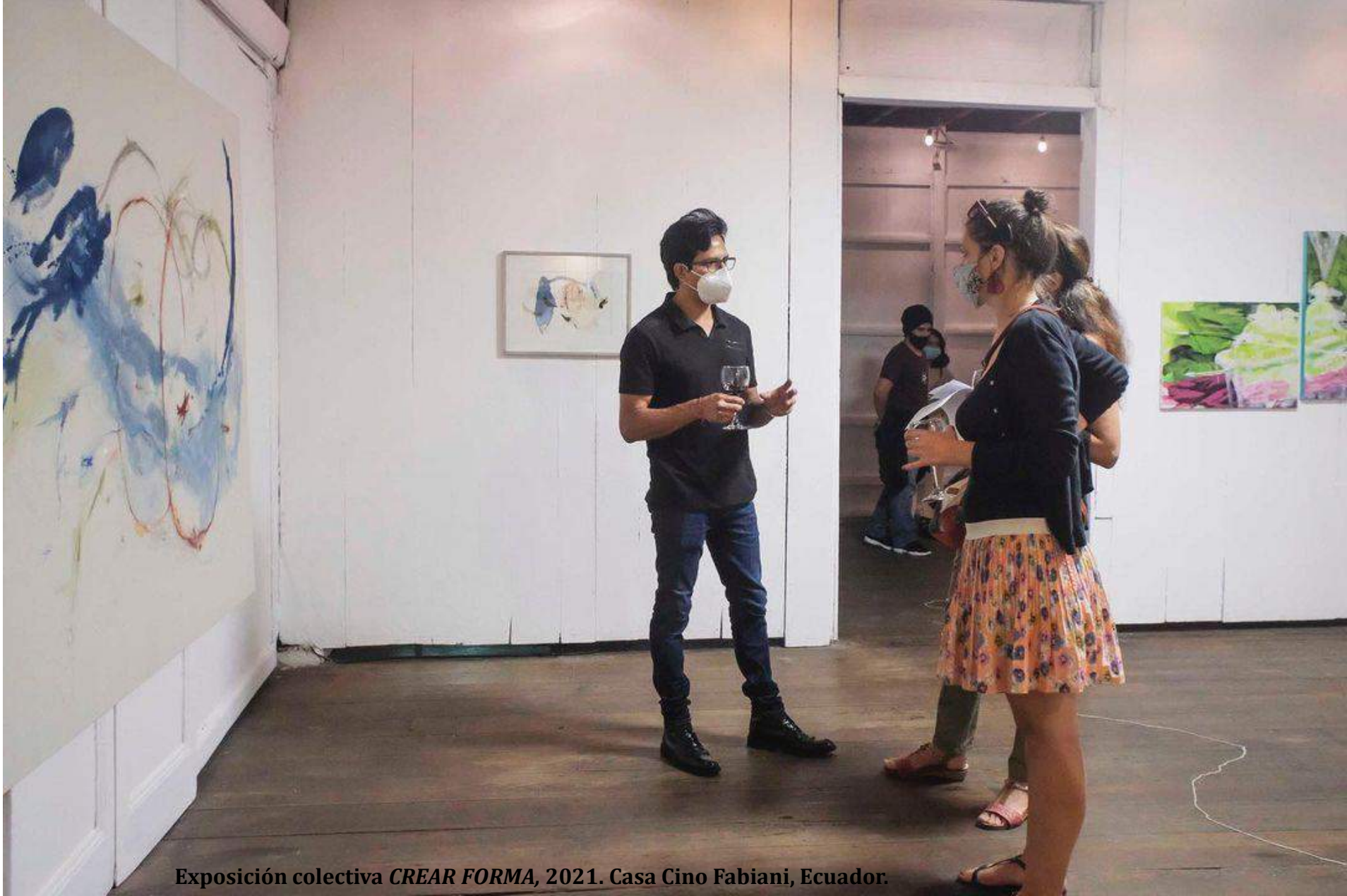
Exposición colectiva CREAR FORMA , 2021. Casa Cino Fabiani, Ecuador.