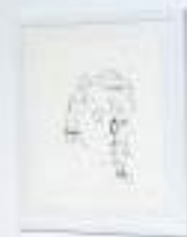
OUT OF PLACE Acrílico y esmalte sobre lienzo 280 cm x 120 cm 2022