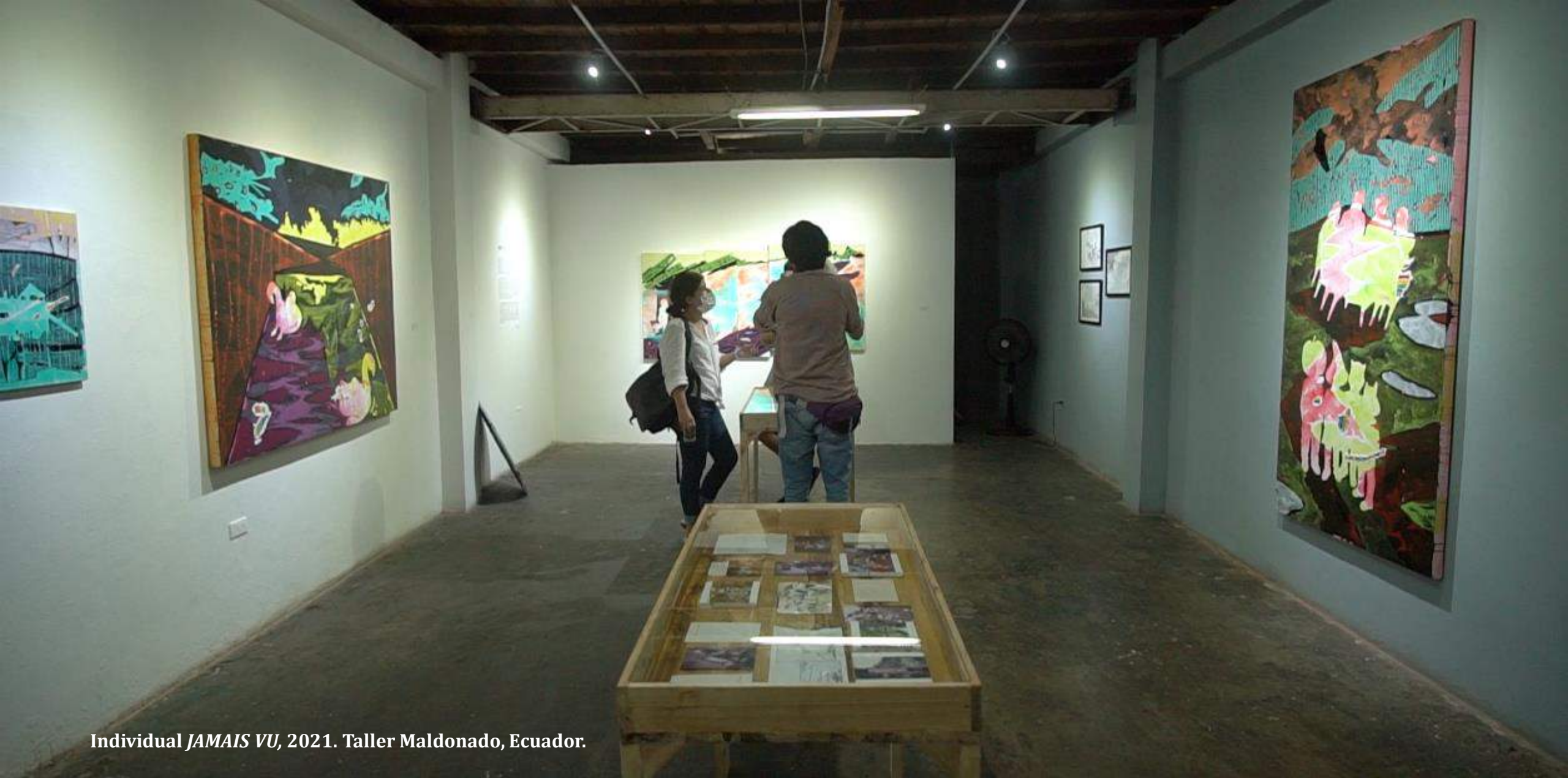
Individual JAMAIS VU , 2021. Taller Maldonado, Ecuador.