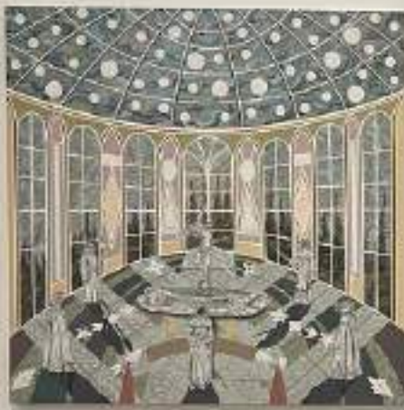
EEDEN Acrílico y esmalte sobre lienzo 160cm x 130cm 2022