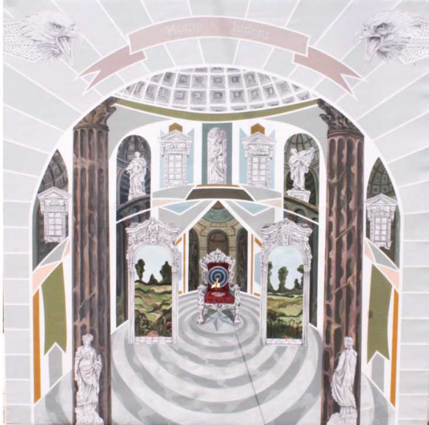
2.- 'Homo ludens (hombre que juega)` Técnica mixta sobre lienzo 150 x 150 cm.