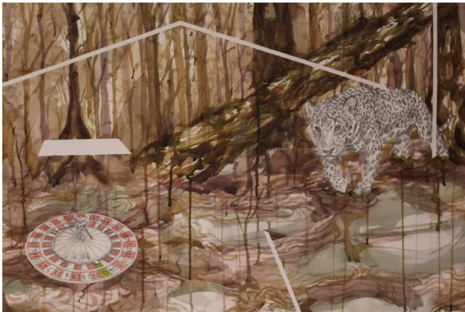
de la Serie 'El azar del siervo' Acrílico y grafito sobre papel Arches 600 gr. 62 x 100 cm