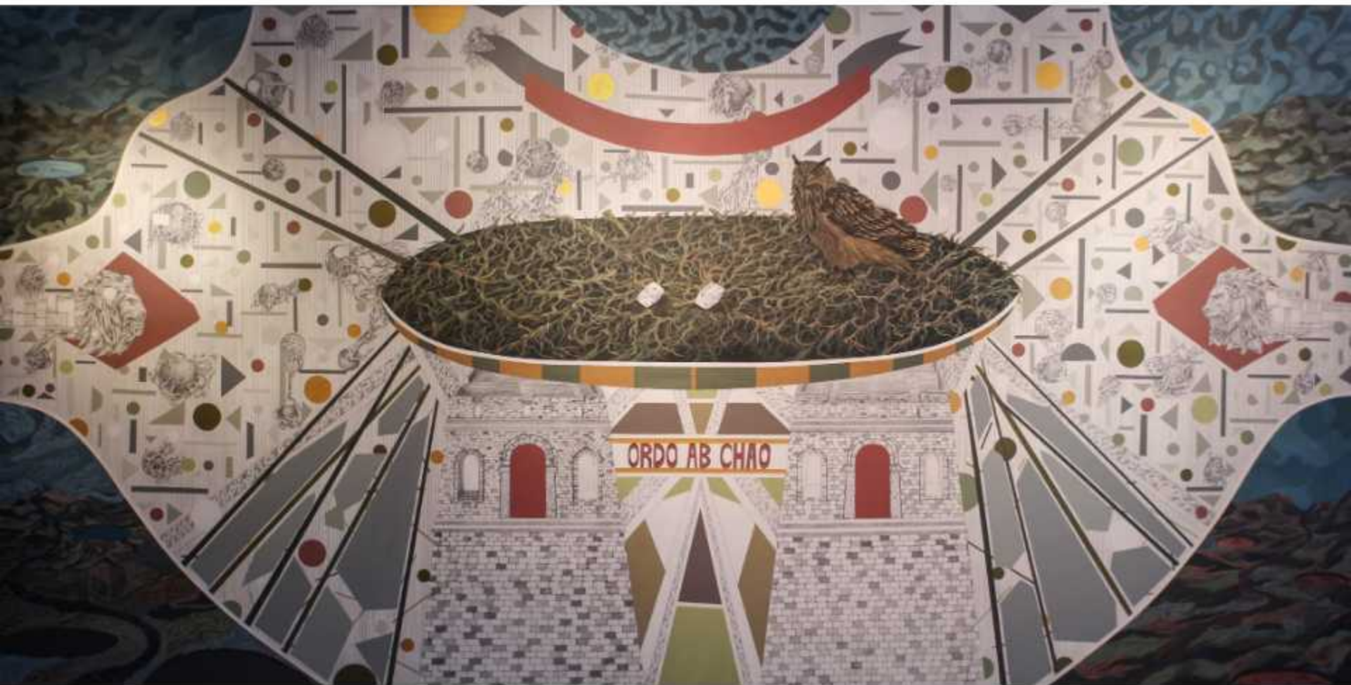
1.- 'Orden desde el caos' Técnica mixta sobre lienzo 400 x 200 cm.