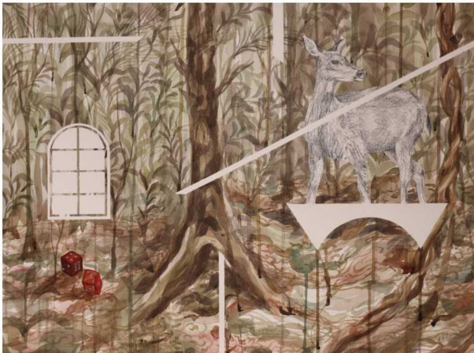
de la Serie 'El azar del siervo' Acrílico y grafito sobre papel Arches 600 gr. 48 x 62 cm