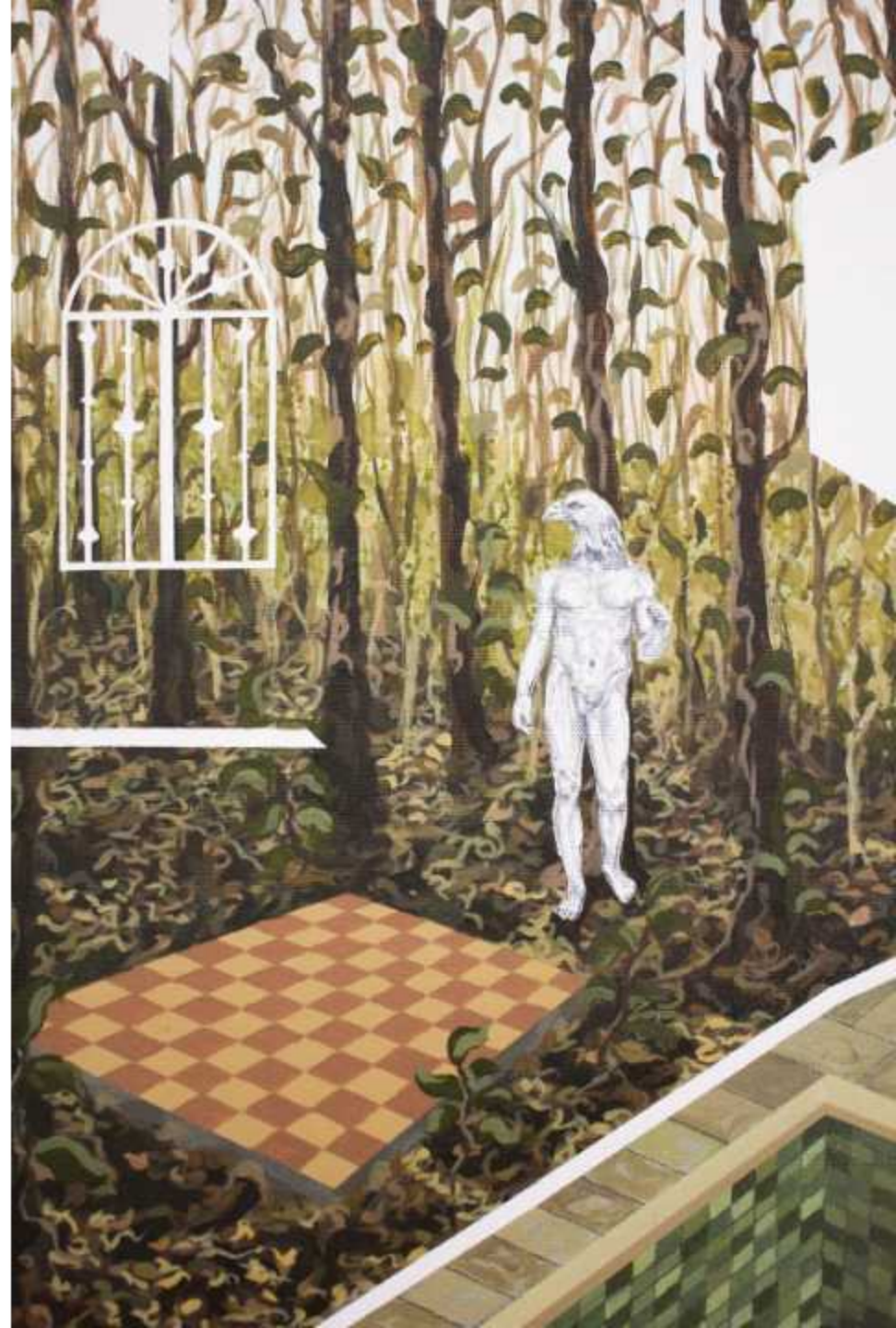
6.- 'El jugador del bosque' Técnica mixta sobre lienzo 60 x 40 cm.