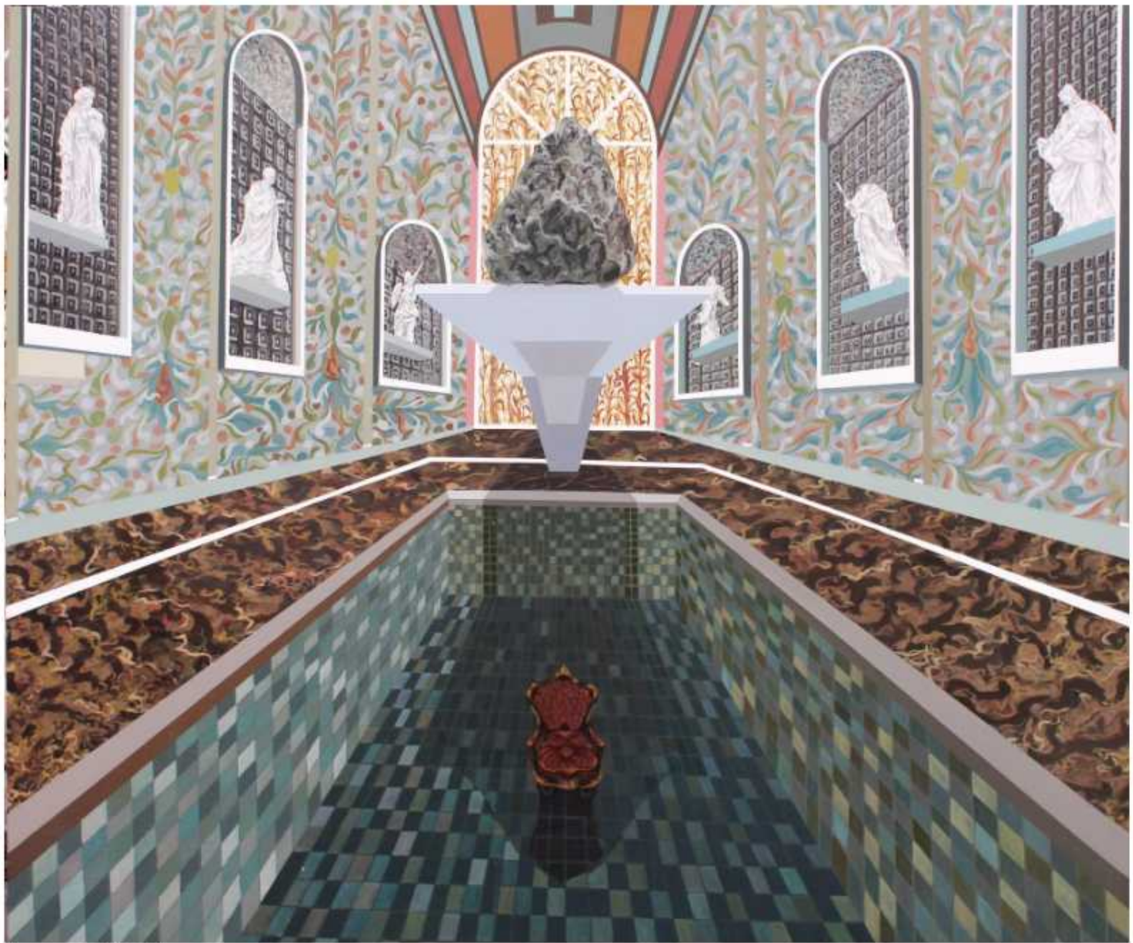
5.- 'Clavado en seco "Sísifo"' Técnica mixta sobre lienzo 150 x 120 cm