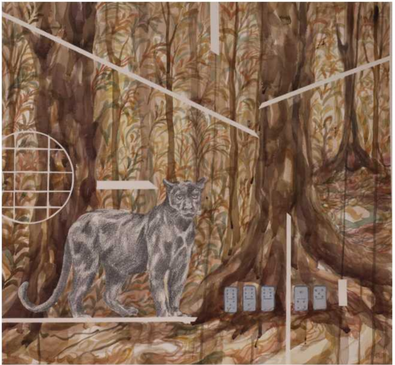
de la Serie 'El azar del siervo' Acrílico y grafito sobre papel Arches 600 gr. 59 x 59 cm.